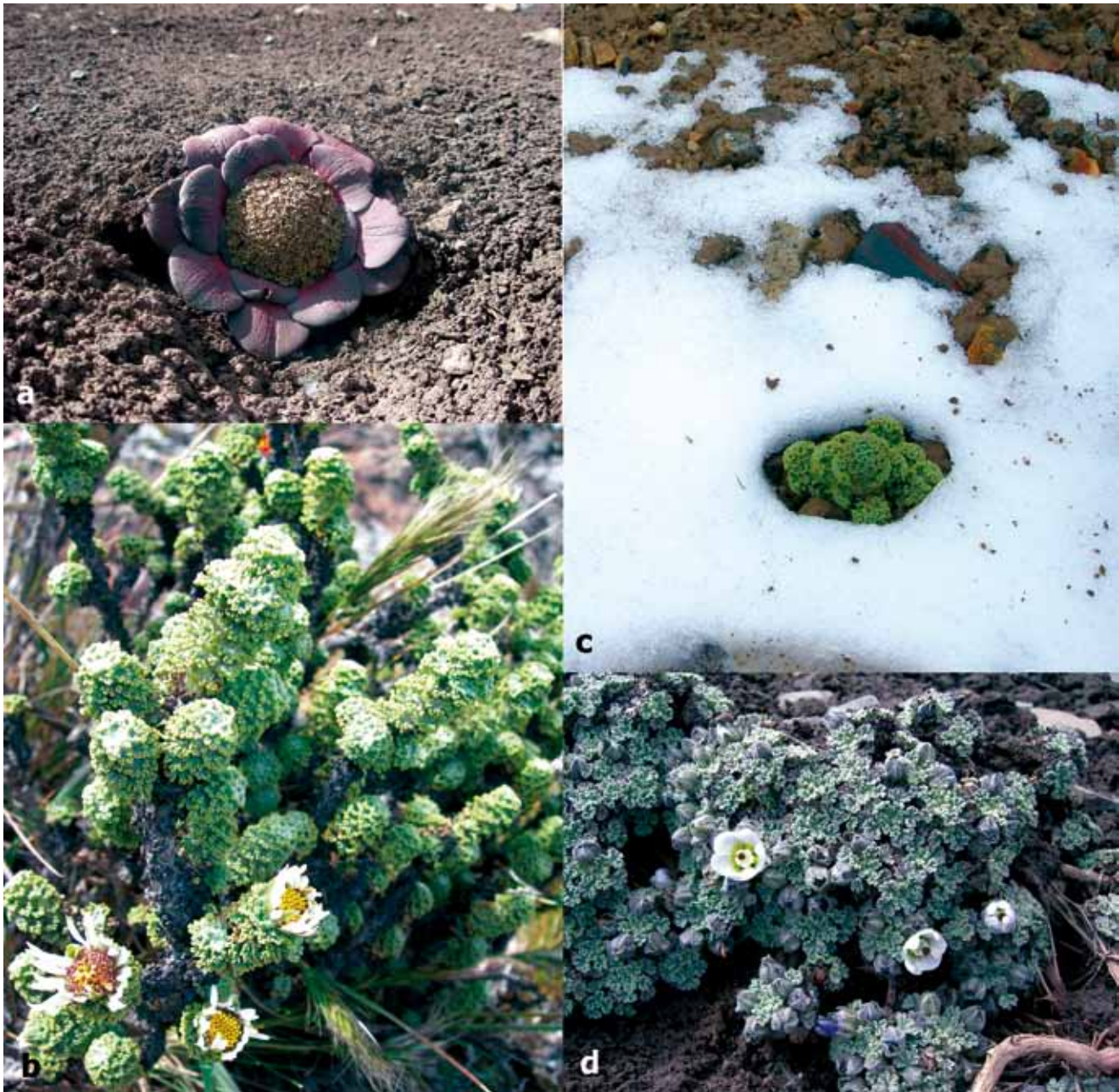
Figura 3. Especies propias de suelos crioturbados: a) Stangea henrici (Valerianaceae), b) Xenophyllum decorum (Asteraceae), c) X. dactylophyllum y d) Nototriche antonina (Malvaceae).

Blake) V.A. Funk, Nototriche antoniana M. Chanco, y Brayopsis sp. (Figs. 3a, 3b y 3d). Una especie que estuvo muy bien representada en este tipo de suelos fue Xenophyllum dactylophyllum (Sch. Bip.) V.A. Funk (Fig. 3c), aunque también fue observada en roquedales. Las restantes 60 (44,11%) especies fueron registradas en la vegetación asociada. La vegetación de los roquedales tuvo la mayor diversidad con 55 especies, seguidas por el pajonal con 47 (Tabla 3).