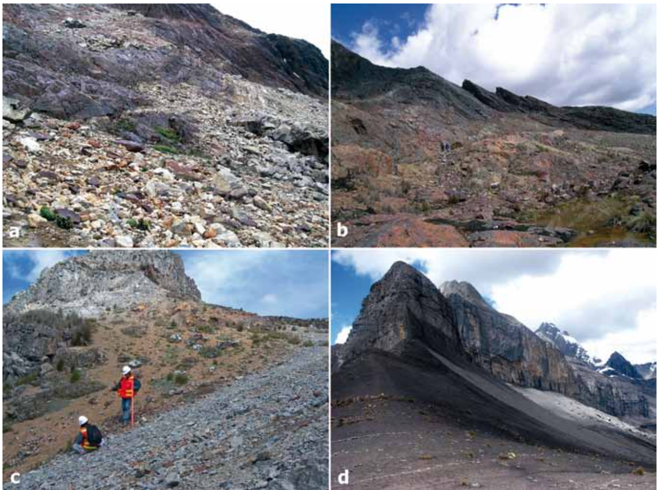
Figura 2. Localidades de estudio: a) Punta Olímpica (Chacas - Asunción), b) Abra de Cahuish (Recuay), c) Antamina (San Marcos – Huari) y d) Abra de Yanashallash (Bolognesi).

http://sislib.ummsm.edu.pe/BVRevistas/biologia/biologiaNE.htm