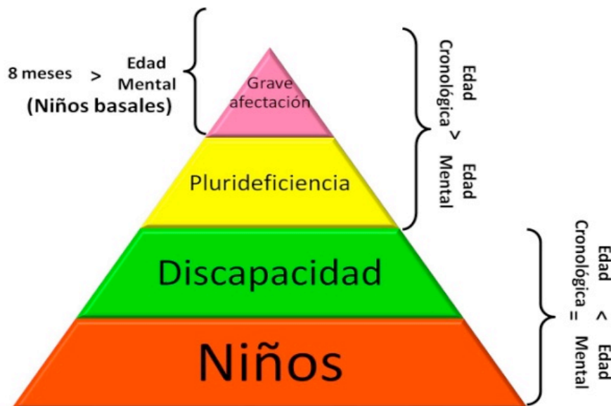
Ilustración 1: Comparación del desarrollo mental alcanzado

Así, un niño con grave pluridiscapacidad va a mostrar unas características que determinan de manera total la intervención educativa a realizar con él. Entre los