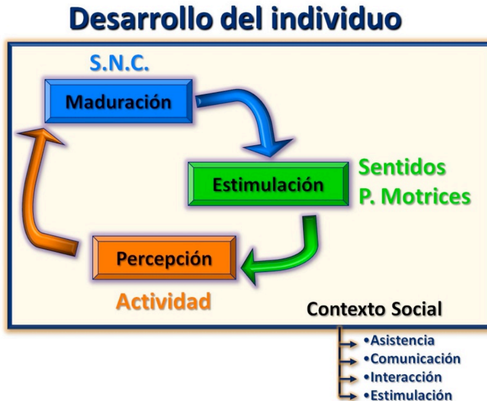
Ilustración 3: Factores que determinan el desarrollo de una persona

Así, el docente debe centrarse en la persona que presenta grave afectación y acompañarla en un camino que potencia su desarrollo, teniendo en cuenta en todo momento su situación y sus necesidades, para construir a partir de ellas la intervención educativa que permita alcanzar el máximo desarrollo global y armónico posible.