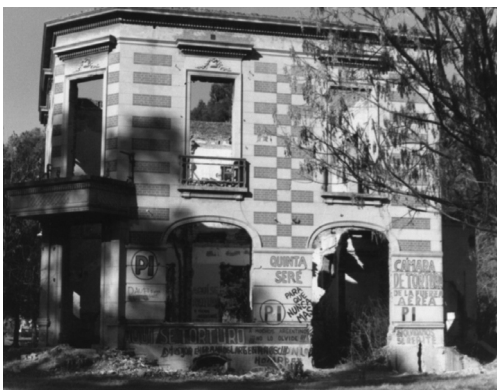
Figura 3. N° 70 año 1985.

la configuración de este espacio como una arena de negociación de diversas experiencias, usos, significados, identidades y memorias que se forjaron a lo largo de su historia de vida y se superponen. Además, puede observarse en las imágenes el deterioro progresivo por causas naturales como la caída de paredes interiores. La fotografía nos permitió observar