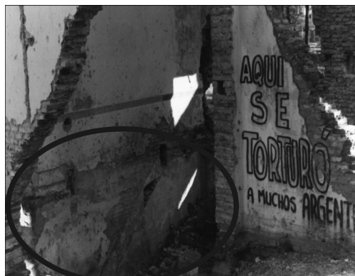
Figura 6. Vista sótano. Fotografía N°73 año 1984.

El último uso del terreno como una cancha