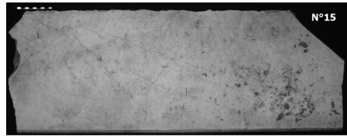
Figura 4. Escalón de Mármol de Carrara donado por vecino. Objeto N° 15.

A partir de las fuentes de información tratadas hasta el momento (el registro de imágenes, los relatos y los objetos reclamados), comenzamos a entender el panorama que se presenta en el registro excavado. El trabajo con estos datos nos permite comprender sesgos y sobrerrepresentaciones de algunos materiales.