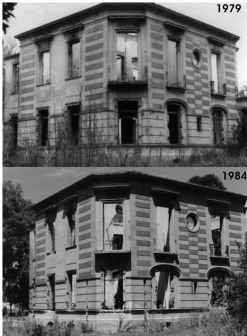
Figura 2. A. N° 14 año 1979/b. N° 64 año 1964.

la configuración de este espacio como una arena de negociación de diversas experiencias, usos, significados, identidades y memorias que se forjaron a lo largo de su historia de vida y se superponen. Además, puede observarse en las imágenes el deterioro progresivo por causas naturales como la caída de paredes interiores. La fotografía nos permitió observar