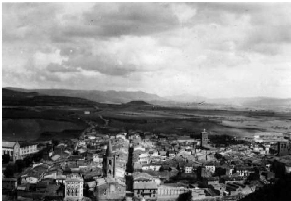
Vista general de Sangüesa.