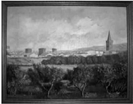
Sangüesa desde el noroeste.