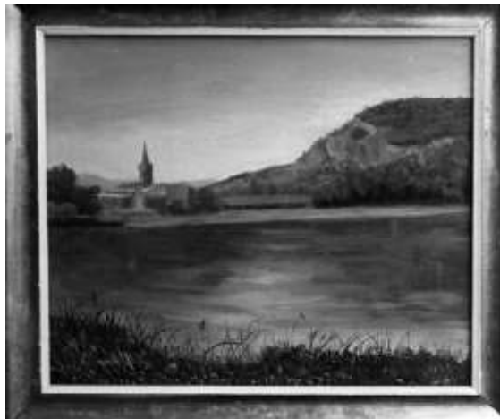
Sangüesa desde Ribalagua