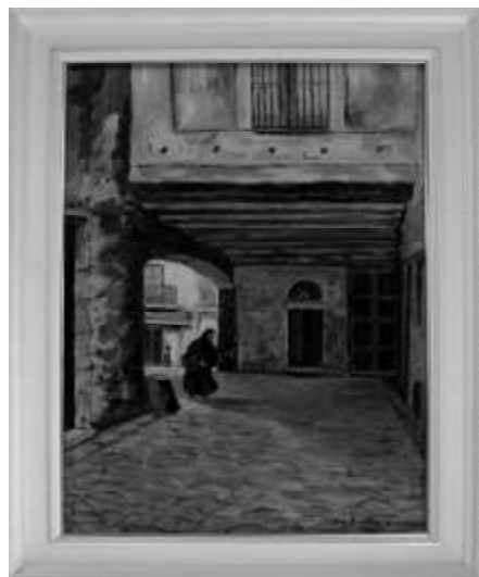
Rincón de la Plaza de la Galería. Sangüesa.