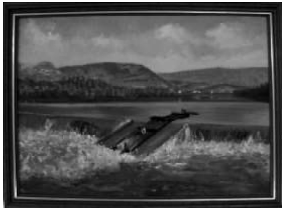
Almadía por el puerto de la presa de la central hidroeléctrica municipal. Sangüesa.