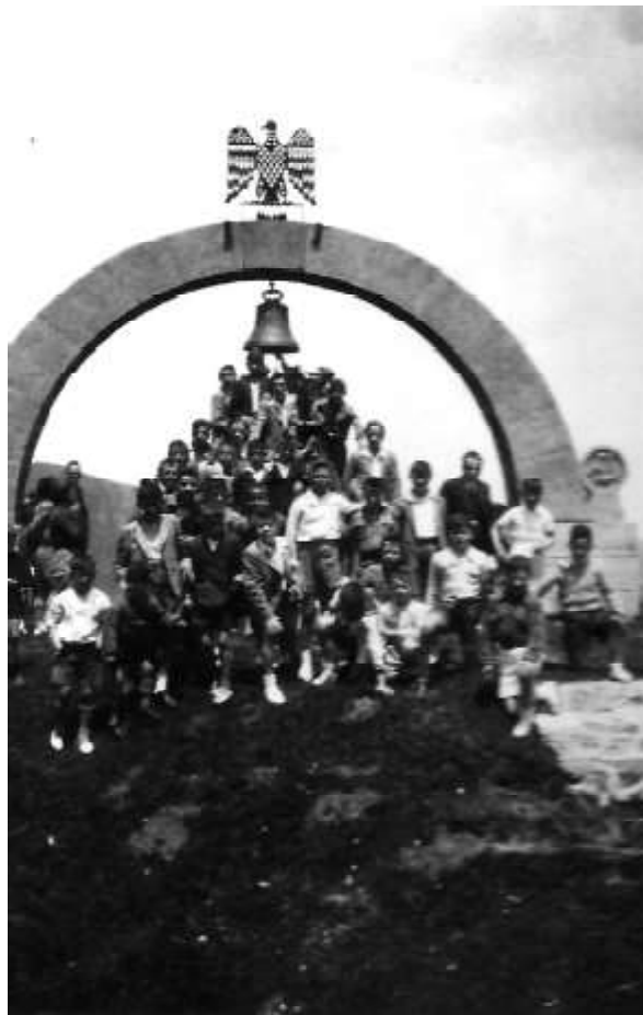
1936. Alumnos de la escuela de Sangüesa en Ibañeta