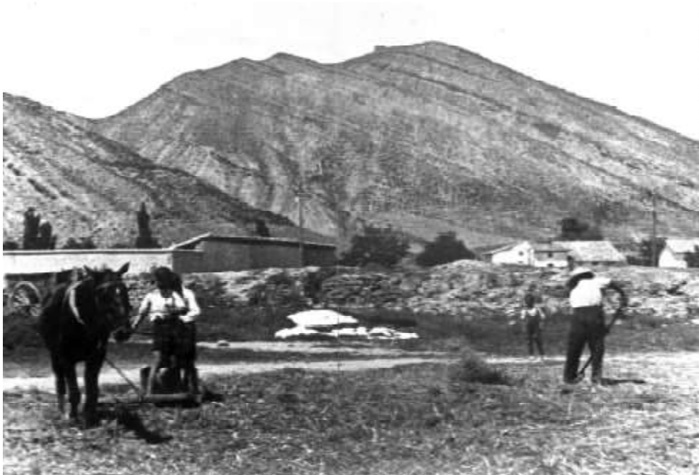
1.937. Sangüesa. Labores de trilla.