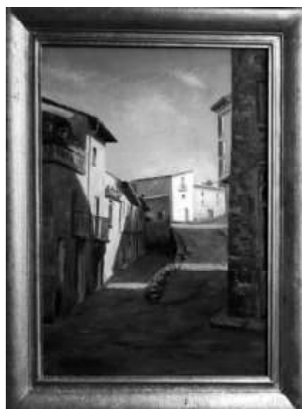
Calle Fermín de Lubián