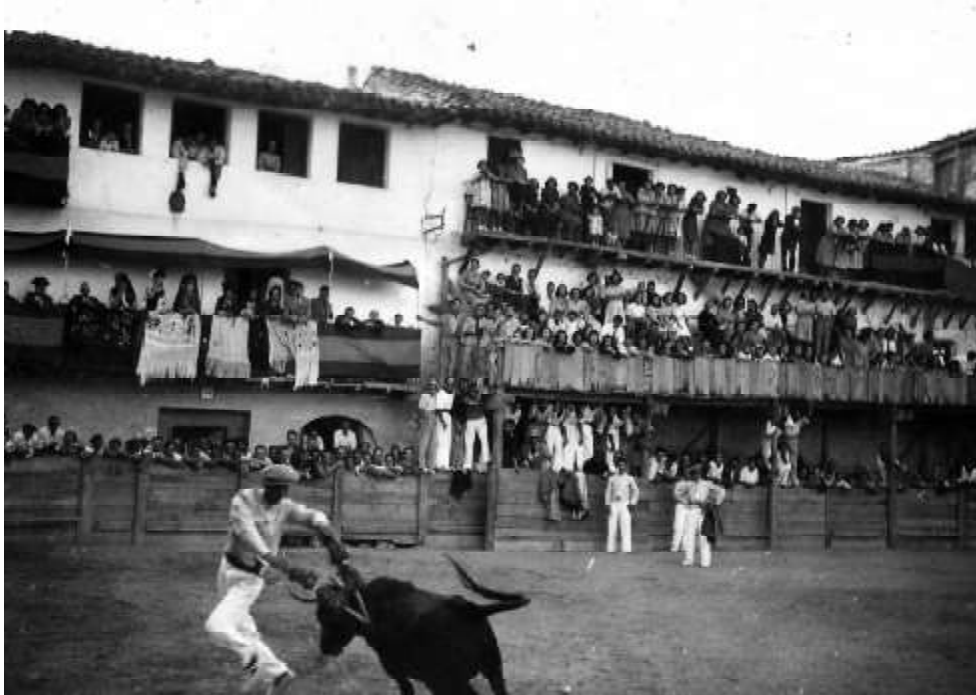
1935. Fiestas de Sangüesa.