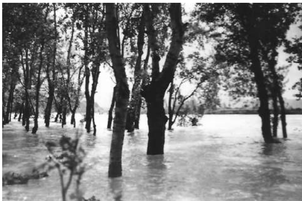
1936. Riada en Cantolagua Sangüesa.