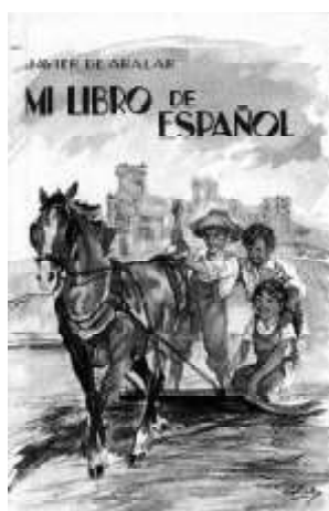
Portada del tomo 1º de “Mi libro de español”, de Faustino Garralda, con el seudónimo Javier de Aralar.