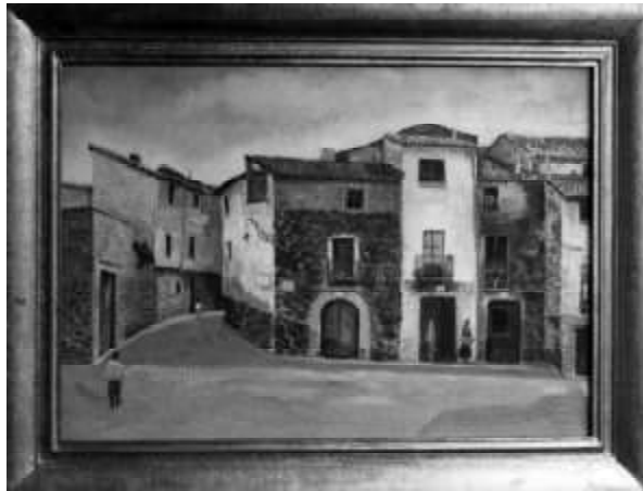
Rincón de la plaza de la Abadía, hacia la calle del Estudio. Sangüesa.