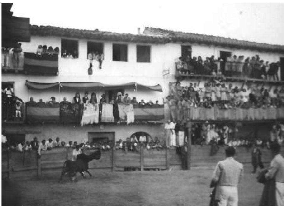
1935. Fiestas de Sangüesa.