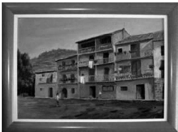
Plaza de San Salvador, antigua plaza de toros. Sangüesa.