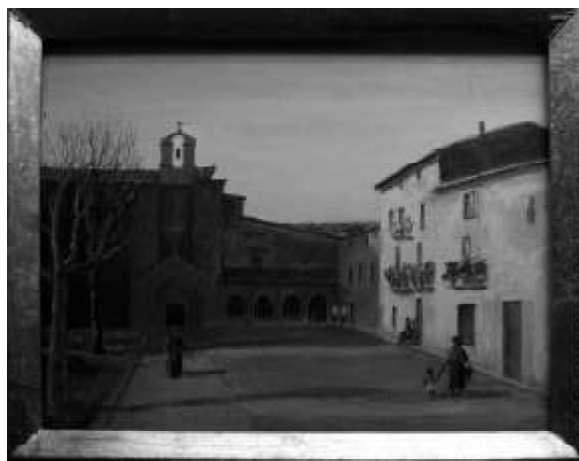
Plaza de los Fueros o del Prao. Convento San Francisco. Sangüesa.