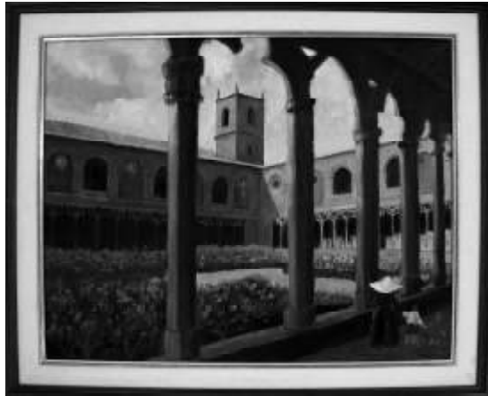
Claustro del Convento del Carmen. Sangüesa.