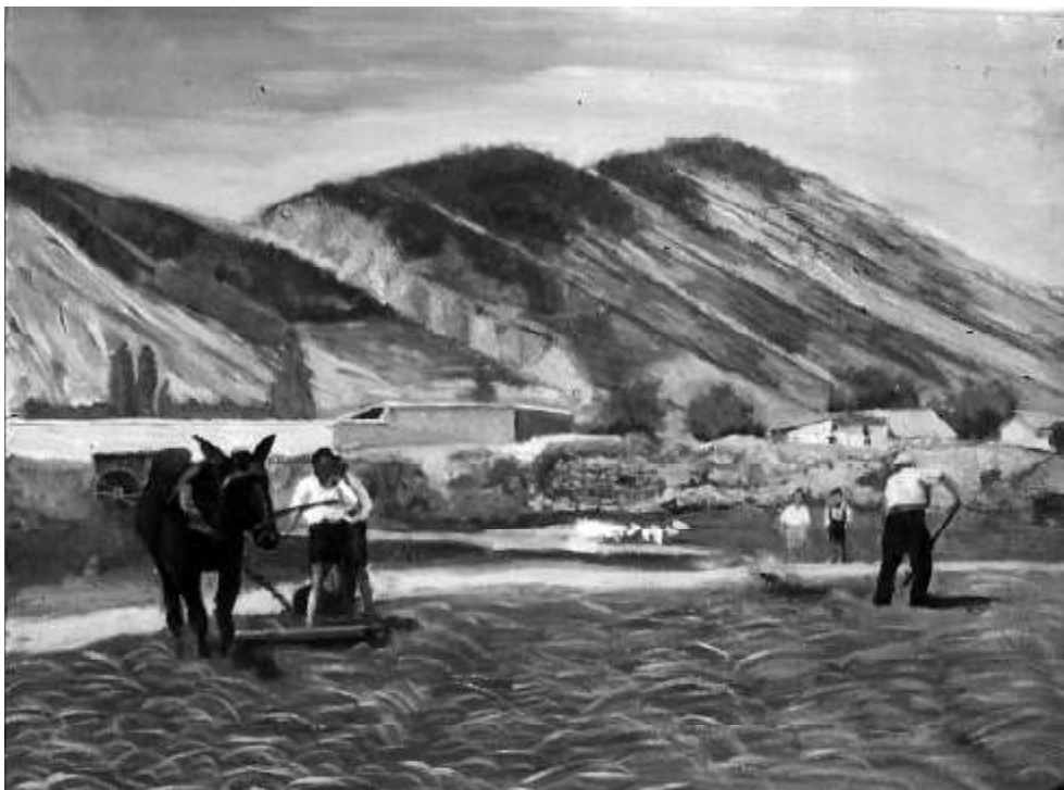
Interpretación pictórica de la fotografía superior