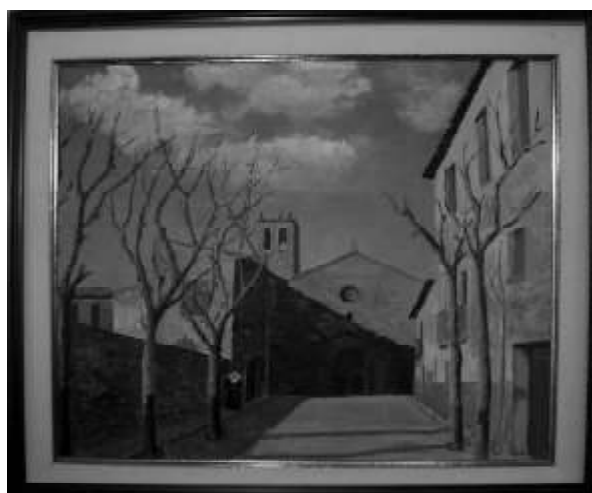
Convento del Carmen. Sangüesa.