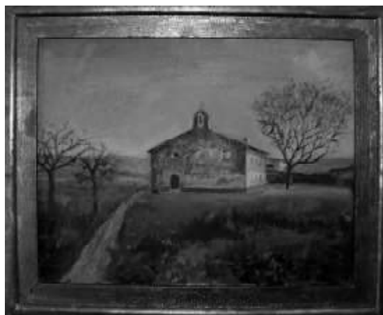
Ermita de San Babil. Sangüesa.