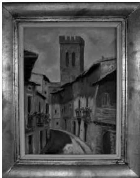
Calle del Estudio. Sangüesa.