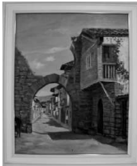
Portal de Carajeas, calle Población. Sangüesa.