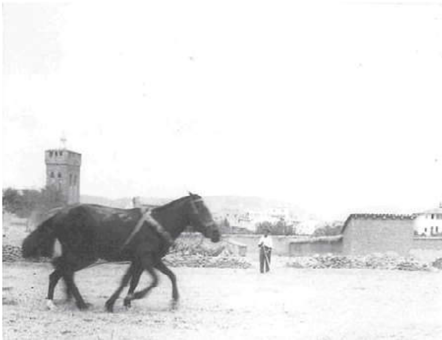
1.937. Sangüesa. Labores de trilla.