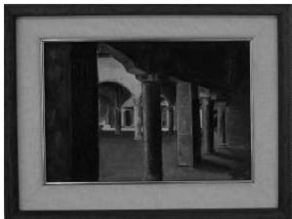
Rincón de la plaza de la Galería. Sangüesa.