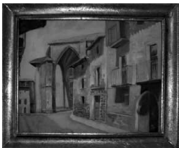
Calle Población. Sangüesa.