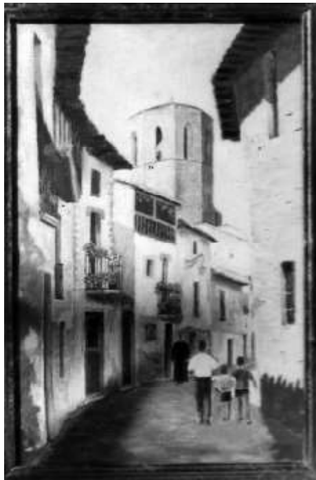
Calle Oscura. Sangüesa.