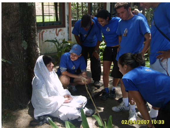
Foto Laboratorio Campamental PILOMATH 2007, Sanatorio Carlos Durán Tomada por Ericka Céspedes

5. Colócate a 25 metros de las ventanas y observa en su interior...dicen que una monja camina por los pasillos y se asoma a saludar... ¿la podrás ver?, si no es así acércate un poco más y busca un rostro femenino pintado en la pared...dibújalo y recoge la nueva pista.