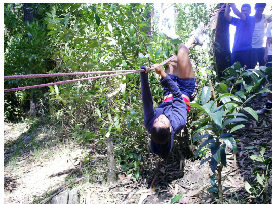
Foto Laboratorio Campamental PILOMATH 2007, Sanatorio Carlos Durán

16. Alerta nacional, los reos han escapado y están tomando rehenes, deberán lograr por medio de una cuerda colocar a tus compañeros en un lugar seguro.