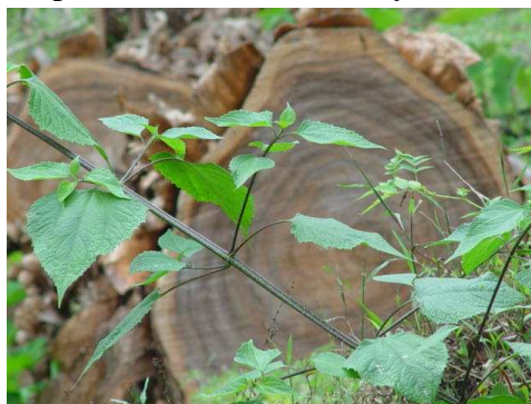
Foto Gira Bosque Eterno de los Niños, Estación San Gerardo 2005

Una vez definido el objetivo y el tema, la siguiente elección es el lugar: un gimnasio, la escuela, el parque, el centro de la comunidad, una finca; cualquiera en realidad puede utilizarse para ejecutar el rally.