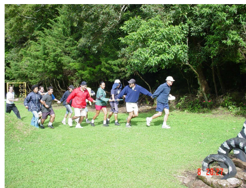
Foto Capacitación Promotores Recreativos 2003, Parque Recreativo Fraijanes