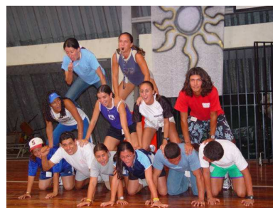
Foto Día Recreativo 2005, Escuela Ciencias del Deporte

Una actividad que congrega a un grupo de personas. Las cuales conforman equipos, con el propósito de recorrer un territorio en un tiempo determinado, buscando o realizando acciones (pistas, acertijos o desafíos) que les permitan avanzar hasta lograr el cumplimiento del objetivo planteado.