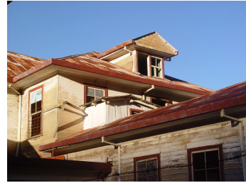
Foto Laboratorio Campamental PILOMATH 2007, Sanatorio Carlos Durán Tomada por María Morera

Objetivo: Conocer la historia del Sanatorio Durán (Sanatorio de los Tuberculosos), en Tierra Blanca de Cartago.