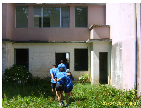
Foto Laboratorio Campamentil PILOMATH 2007, Sanatorio Carlos Durán Tomado por Ericka Céspedes

3. Lo peor está por venir...ustedes han descubierto que han dejado adentro un policía y ha muerto producto de la rebelión de los reos...la siguiente pista la encontrarán donde vivía el policía fallecido.