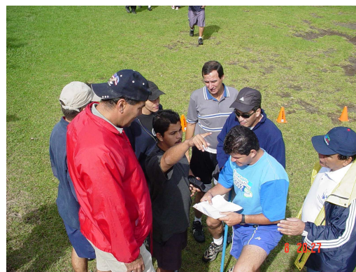
Foto Capacitación Promotores Recreativos 2003 Parque Recreativo Fraijanes

Pista 3: en el río, por donde iniciamos, encontrarás un cruce. Sigue el camino de la izquierda, pasa la pendiente, y sigue directo sobre el y al final te topará un hueco.