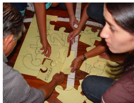
Foto Campamento Padres y Madres Grupo 02 2005, Escuela Ciencias del Deporte, UNA

Grupos: cuatro grupos divididos equitativamente, requisito que no se conozcan entre sí.