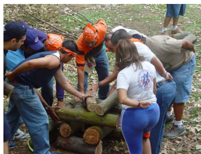
Foto Capacitación Promotores Recreativos 2004, Parque Metropolitano la Sabana

En el caso de que se trabaje con pista, una forma de controlar es que los equipos las recojan y las carguen durante todo el recorrido. Si es un acertijo una tarjeta de control donde coloquen la respuesta podría ser la solución. Y si es un desafío una clave puede ser una letra, una bandera, o un objeto.