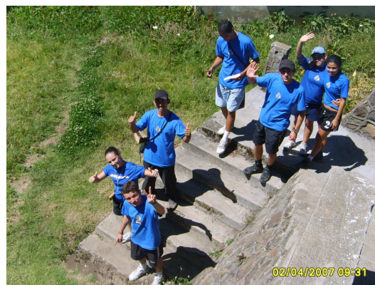
Foto Laboratorio Campamentil 2007, Sanatorio Carlos Durán

Se les entregarán los desafíos en el centro del gimnasio, lugar a donde deben volver después de finalizar cada uno. Para cada uno habrá un juez quien verificará que las reglas se cumplan.