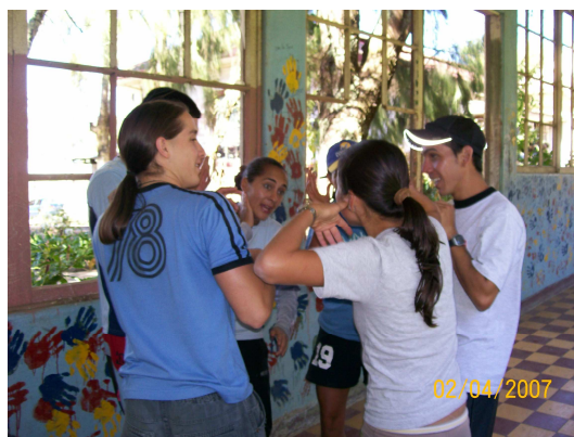
Foto Laboratorio Campamental PILOMATH 2007, Sanatorio Carlos Durán

8. Han informado que hay un niño en el salón corriendo por los pasillos...dicen que no puede encontrar su juguete y por eso ha alterado la tranquilidad del salón...busca el juguete y déjalo en el patio para que el niño no interrumpa más la labor de los enfermeros.