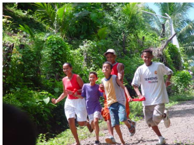
Foto Capacitación Grupo de Jóvenes, Isla Venado

Revolución Industrial, época que provocó un crecimiento del tiempo de trabajo y una consolidación efectiva de este, donde la jornada laboral es más extensa, tuvo lugar una ruptura entre el trabajo y el tiempo libre. A partir de ese momento, este es considerado el reino de la libertad (Ministerio de Educación y Ciencia, 1996).