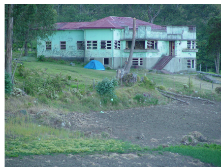
Foto Castillo, Sanatorio Durán 2007

1. Le llaman el castillo, su color es como el cielo, cuenta la historia que ahí dormían las monjas y también los administradores...deberán subir a la cima marchando al mismo son, no deben desafinar, sus pasos firmes deben sonar. El objetivo será, libertar todos los temores para luego echarlos a volar... (Los estudiantes, escriben en una hoja una palabra o una frase que les este provocando temor, angustia, miedo, etc. Producto del rally o de su vida cotidiana... Una vez hecho esto, hacen el papel en forma de avión y lo liberan por una de las ventanas. (Que deberán recoger al salir del castillo)