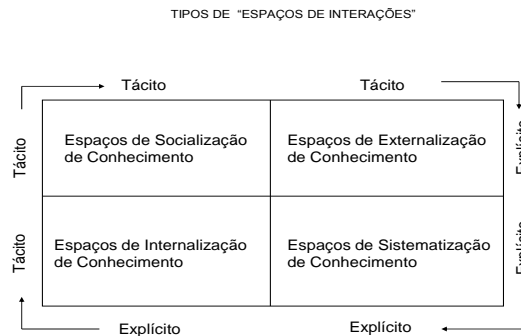
Figura 2 – Tipo de “ESPAÇOS DE INTERAÇÕES