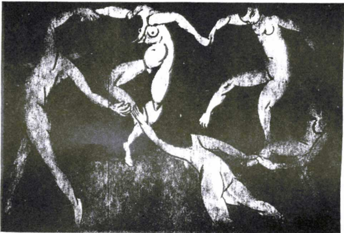
Matisse: La Danza . Museo de Arte Occidental. Moscú.

Más, quienes tenemos la profunda convicción en el destino progresivo de nuestra humanidad, sabemos que mucho más temprano que tarde, en el amanecer histórico y jamás en el ocaso, el derecho a transitar por las grandes avenidas lúdicas, del gozo, del placer, de la libertad, será una realidad.