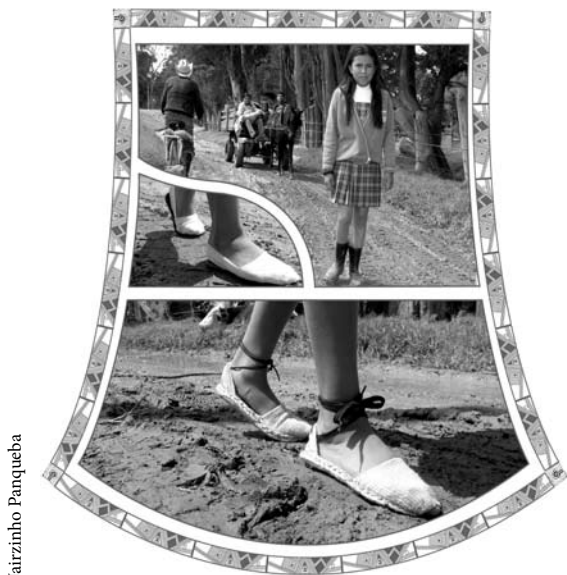
Catalina Tunjo recorriendo territorio de afectos y barro, 2003.

ciarán las diferentes prácticas de esta población respecto de las muchas otras dinámicas de Bogotá.