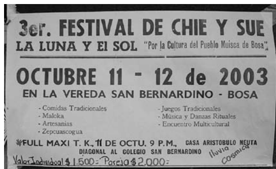
Cartel del tercer Festival de Chie y Sie, 2003.

para la interculturalidad. No pretende hacer un gueto muisca, sino promover la convivencia entre lo que consideran “lo muisca” y lo “fuereño” —las personas y costumbres consideradas como “no muiscas”.