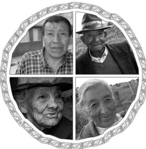
Cuatro generaciones indígenas muisca en la memoria educativa de San Bernardino, 2006.

Corporación Ambiental y Empresarial TINGUA