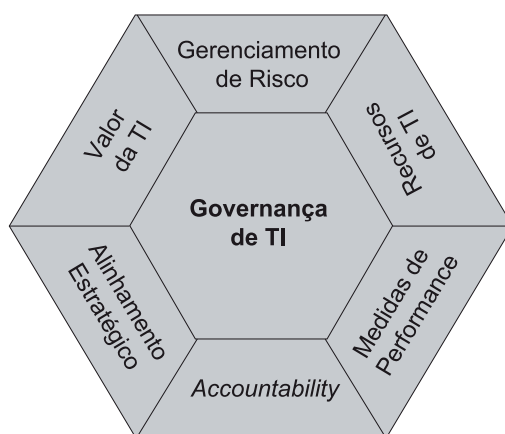
Figura 1: Modelo de efetividade da Governança de TI