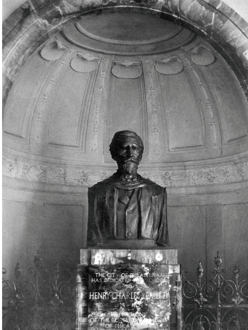
HCLP, caja 202, Estatua conmemorativa.