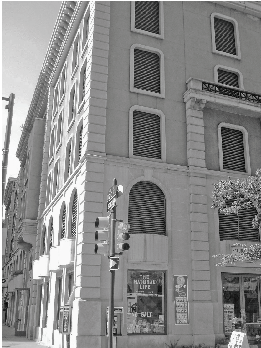
Estado actual de la residencia de Henry Charles Lea, en el 2000 de Walnut St., Philadelphia.

Fredericq. Academie Royal de Belgique. Commission Royale d'Histoire. Bruxelles 2004.