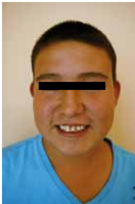
Figura 1. Se observan manchas color pardusco predominantemente en incisivos centrales que corresponden a la clasificación 6TF

Desde entonces era efectiva la técnica de microabrasión sin instrumentos rotatorios. Existen en el mercado variedad de sistemas diseñados para la microabrasión con instrumentos rotatorios de baja velocidad y con ello se ha aumentado la necesidad de utilizar restauraciones después de la microabrasión con aplicación mecánica. Dado que no es posible medir la profundidad de la lesión antes de llevar a cabo el tratamiento y no podemos saber si la lesión en todos los casos fue profunda o el control de la presión provocó un desgaste mayor, es conveniente volver a utilizar la técnica de microabrasión manual que proporciona mayor control del desgaste en el esmalte. 14 Por lo anterior no coincidimos con Croll y Segura, que mencionan que es difícil controlar la disolución del esmalte por contacto con el ácido clorhídrico, comparando la erosión del esmalte en una técnica con instrumentos rotatorios mas el ácido clorhídrico y abrasivos; a este respecto la disolución del esmalte es lógicamente menor y más lenta con un algodón impregnado con ácido clorhídrico que la erosión del esmalte con instrumentos rotatorios y abrasivos. 9