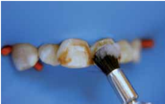
Figura 5. Pulido con piedra pómez, agua y cepillo a baja velocidad