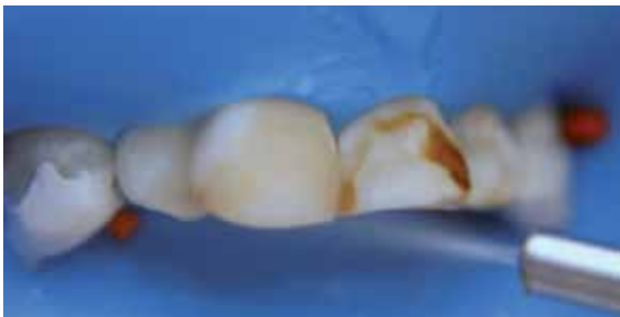
Figura 9. Después de la aplicación del ácido clorhídrico al 18% durante 6 minutos en el incisivo central superior izquierdo, se interrumpe la aplicación y se lava durante 4 minutos con la jeringa triple