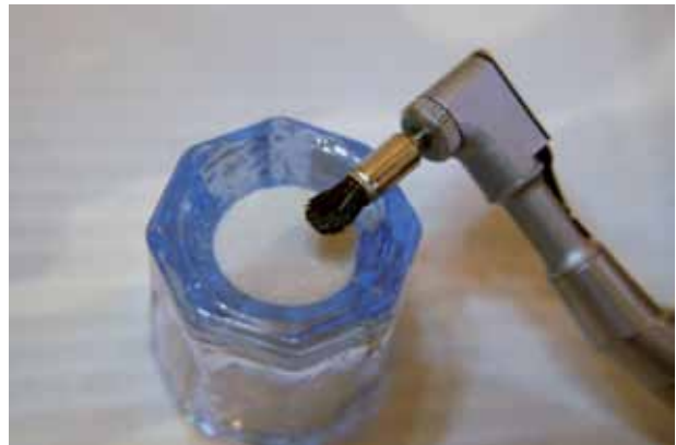
Figura 4. Dappen de vidrio con piedra pómez y agua mezclados para cepillar los dientes a tratar