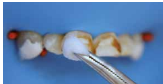
Figura 8. Se talla cada diente 6 minutos con torundas de algodón y movimientos de mesial a distal