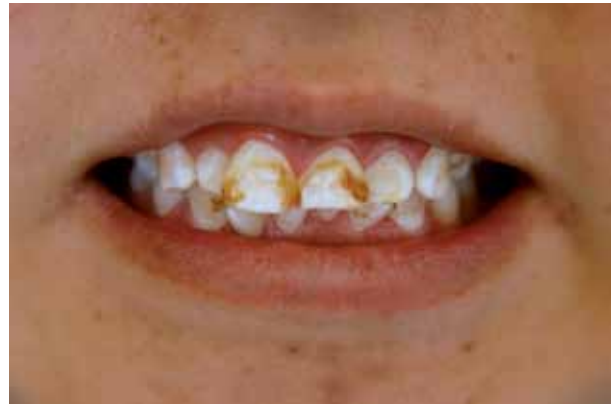
Figura 2. El paciente presenta fluorosis grado 6TF y apiñamiento dental superior e inferior