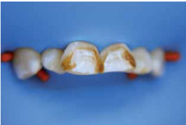
Figura 3. Aislamiento absoluto con dique de goma