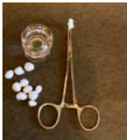
Figura 7. Las torundas de algodón embebidas con ácido clorhídrico son llevadas con una pinza mosquito hacia la superficie del diente con defecto