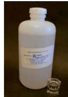
Figura 6. Ácido clorhídrico al 18% en un Dappen de vidrio