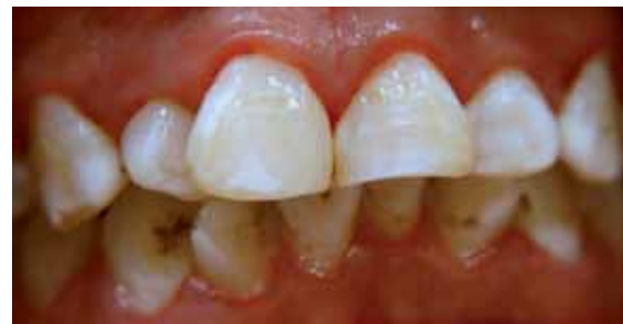
Figura 10. Después del pulido del esmalte