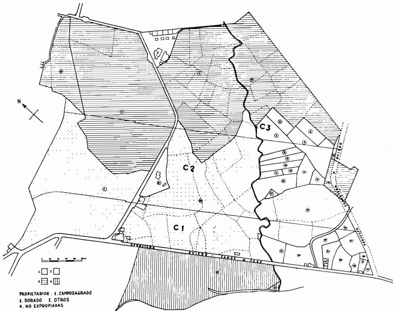
Fig. 2. Terrenos con expectativas urbanísticas, en 1957.

propiados deberían ser objeto de uso en el plazo máximo de 15 años, clasificándose en el grupo III, categoría C, grados 1, 2 y 3 (Decreto de 21-VIII-1956). La calificación de los terrenos afectados (Fig. 2) se hace en función de la distancia a la carretera Oviedo - Campo de Caso (C1 hasta 100 metros lineales, a 28,12 Ptas. el metro cuadrado; C2 los 200 metros siguientes, a 22,14 Ptas., y C3 el resto, a 15 Ptas.), valoración que favorece especialmente al marqués de Camposagrado, porque la mayoría de sus terrenos corresponde a los grupos C1 y C2.