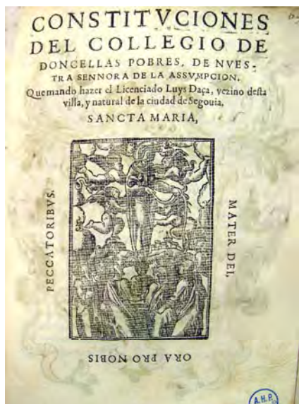
Fig. 1: Constituciones del Colegio de Doncellas Nobles de Valladolid. 1587.

gules (Daza); mantel siniestro de plata, con un león rampante de oro, armado de sable y lampasado de gules; timbre: yelmo de hidalgo en plata con rollo y dependencias de oro, con tres plumas blancas por cimera y lambrequines de plata y gules. Estamos ante un ejemplo de escudo de armas familiar que se convierte en escudo de armas “de comunidad” por voluntad del fundador, como un siglo antes ocurriera en el Colegio Mayor de Santa Cruz o del Cardenal. Dicho escudo, sin timbre y con el león rampante en púrpura, figura en el folio 64 del Armorial 11 de la Biblioteca del Palacio de Santa Cruz de Valladolid (fig. 3). No hemos encontrado trazas de linaje en la segunda manteladura, que podría recoger el emblema heráldico de la Orden de San Jerónimo, cuyo hábito llevaban las colegialas. De ser así estaríamos ante un diseño heráldico creado especialmente para el Colegio a partir de las armas familiares del fundador, añadiendo el león de los Jerónimos. También es cierto que en el arco central de la capilla de la Asunción del Monasterio del Parral de Segovia figura un escudo partido: 1 cortado de Daza y Espinar y 2 león rampante, que podía corresponder al linaje Aguado de la abuela de Luis Daza.