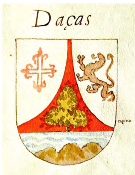
Fig. 3: Escudos de Armas . Anónimo, h. 1615. Escudo de los Dazas. Biblioteca del Colegio de Santa Cruz. Universidad de Valladolid. ms. 256, fol. 64.

“Ytem estatuímos que en las puertas de la yglesia y portería deste Collegio, y en la capilla mayor, choro, y capítulo, refitorio, dormitorio y quarto de seglares, y en las demás partes que al patrono pareçiere, se pongan las armas del fundador en un escudo, o dos, qual al patrono pareçiere, las quales prohibimos que ahora y en ningún tiempo se puedan quitar ni mudar ni añadir poniendo las armas de las mugeres de los patronos ni de sus maridos, sino que para siempre jamás permanezcan las del fundador solas”.