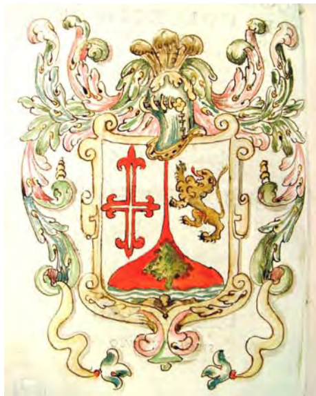
Fig. 2: Escudo del Colegio de Doncellas Nobles. 1587. AHPVa.