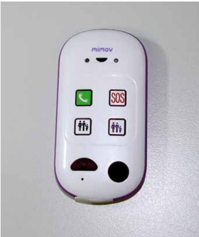
Figura 4. MIMOV.

modificaciones oportunas se iban realizando antes de avanzar con el diseño del producto, lo que supone un beneficio importante para la empresa. Por ejemplo, se recomendó la sustitución de los iconos de los botones existentes por otros que facilitarían la comprensión, mayor contraste y ajustar el tamaño de los símbolos de estos iconos (Figura 5). Al finalizar el proceso de asesoramiento, MIMOV se sometió al proceso de evaluación para la obtención del certificado SIMPLIT.