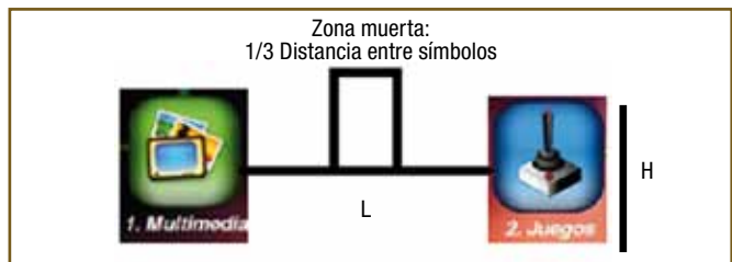
Figura 3. Distancia entre símbolos.

En el sistema SIESTA se habían tenido en cuenta diversos criterios de usabilidad y de accesibilidad como, por ejemplo, poder controlar el sistema con movimientos de cabeza o mediante golpes en la superficie de apoyo, lo que facilitó y agilizó el proceso de asesoramiento pese a estar en una fase avanzada de desarrollo. Durante el proceso de evaluación SIMPLIT los usuarios calificaron el sistema como sencillo, con navegación intuitiva y con una pantalla táctil muy fácil de utilizar, más que un ratón convencional.