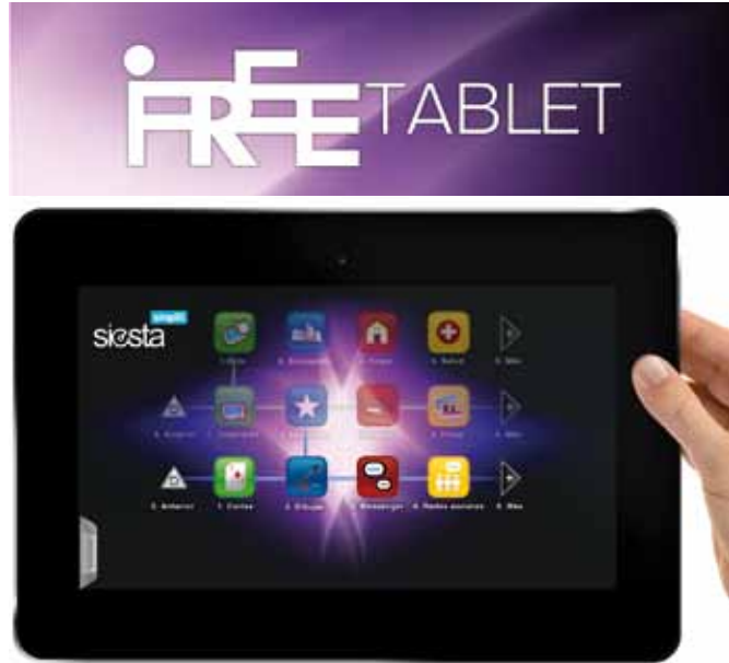
Figura 2. Sistema Operativo Siesta.

producto permite al usuario controlar el entorno, gestionar aspectos de salud y acceder a contenidos informativos y de ocio. El IBV realizó el asesoramiento en la fase de desarrollo en detalle sobre los requisitos que debía cumplir y, como consecuencia del mismo, se llevaron a cabo las modificaciones oportunas para adecuar el producto. Por ejemplo, se recomendó variar la distancia que debía existir entre los diferentes iconos de la pantalla para facilitar su manejo (Figura 3).