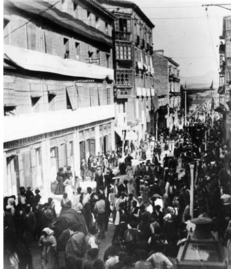
Láms. 3 y 4. Primeras sedes del periódico La Rioja, en el entresuelo del edificio de Correos Viejo y en los bajos del edificio de la calle Sagasta.