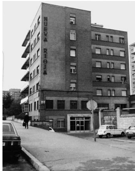
Láms. 5 y 6. Redacción y talleres del periódico La Rioja en el siglo XX: edificio de la plaza Martínez-Zaporta y de la calle General Vara de Rey donde continúa en la actualidad.