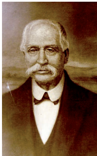
Lám. 1. Facundo Martínez-Zaporta, fundador del periódico La Rioja en 1889.

Además la Ley en su artículo décimo octavo señala los efectos que tendrá en el Código Penal los “considerados como clandestinos” y el décimo noveno las multas que se impondrán por infracciones a la ley, incluyéndose en el artículo veinteavo la prohibición que podrá ejercer el Consejo de Ministros en caso de llegar impresos desde el extranjero aunque estuvieran escritos en español 14 . En cualquier caso hacer notar que la presente ley sirvió tanto para los largos años de la denominada Restauración, como la dictadura de Primo de Rivera aplicada aleatoriamente en función del Gobernador de cada provincia y la Segunda República, sólo limitada, en este caso, por la Ley de Defensa de la República. Como bien escribe Miguel Artola este nuevo marco legal será “elemento esencial para caracterizar un sistema de relaciones sociales como político o de poder” 15 , aunque, es cierto, que todavía se constatará una excesiva discrecionalidad en los gobernadores civiles, pero supondrá un