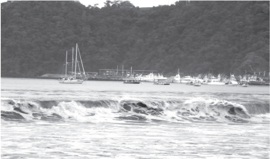
Fotografía 1: Paisaje costero costarricense.

la integración entre las ciencias sociales, entre las ciencias naturales y entre ambos bloques, que permita interpretar los procesos de cambio en el ambiente de manera integral.