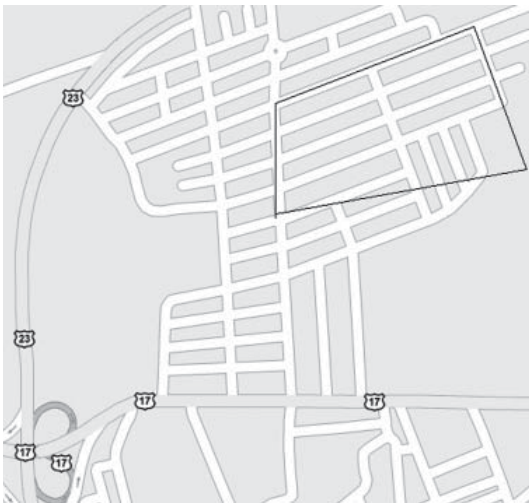
Figura 1. El Roble 2, Distrito El Roble, Cantón Central de la provincia de Puntarenas.

Por estos motivos, se eligió El Roble 2 del distrito de El Roble de Puntarenas. En la figura 2, puede observarse la ubicación de este residencial. La figura 3 muestra la ubicación de El Roble 2 dentro del mapa de la lengüeta de Puntarenas.