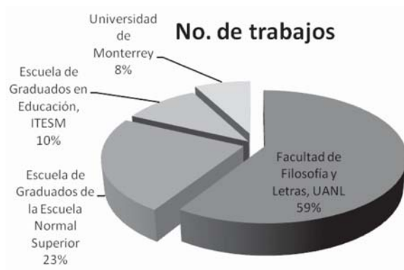
Fig. 1. Muestra de la población investigada.

De la muestra anterior se excluyó la UPN, por no contar con trabajos realizados dentro del periodo 2000-2005. En el resto de las IES, los trabajos analizados, pertenecientes al periodo 2000-2005, son tesis, tesinas y artículos de divulgación. Se encontraron 23 trabajos en la Facultad de FyL de la UANL, nueve en la Escuela de Graduados de la ENSE, cuatro en la Escuela de Graduados del ITESM y tres en la UDEM,