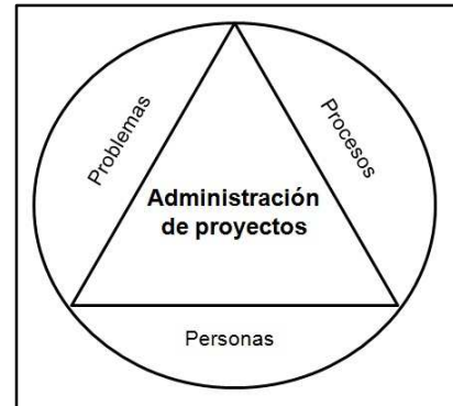
Figura 1. La administración de proyectos (Jalote, 2002)

La gestión de proyectos es un complejo sistema de procedimientos de gestión, prácticas, tecnologías y conocimientos, en el que es necesaria la experiencia para gestionarlos con éxito. La gestión de proyectos de software es una actividad lineal en la Ingeniería de Software. Se inicia antes que cualquier actividad técnica comience y continúa durante todas las etapas de desarrollo hasta el mantenimiento.