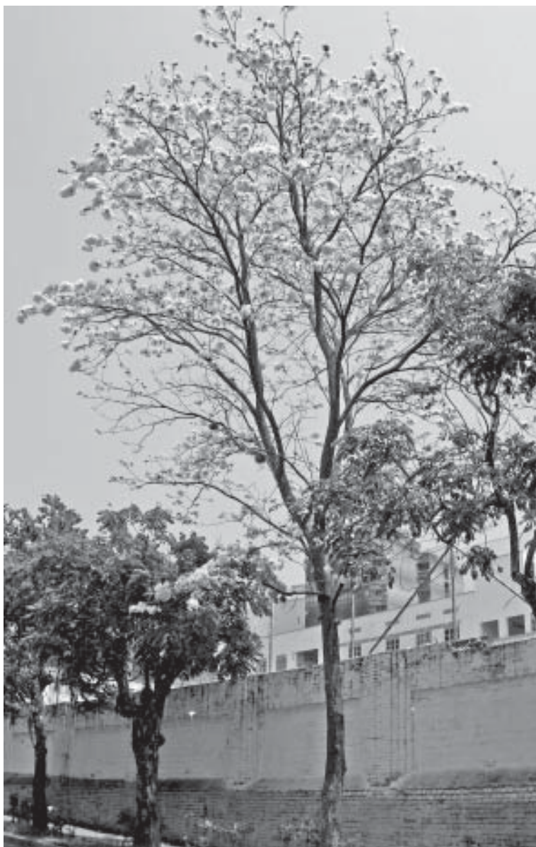
Guayacán floramarillo Tabebuia chryshanta

Familia: Bignoniaceae. Origen: América tropical desde México hasta Colombia y Venezuela. Crecimiento: rápido. Raíz: profunda. Tallo: recto de corteza fisurada. Hojas: compuestas, digitadas, con cinco foliolos, color ferruginoso. Flores: grandes muy llamativas, de color amarillo. Fruto: habichuela alargada.