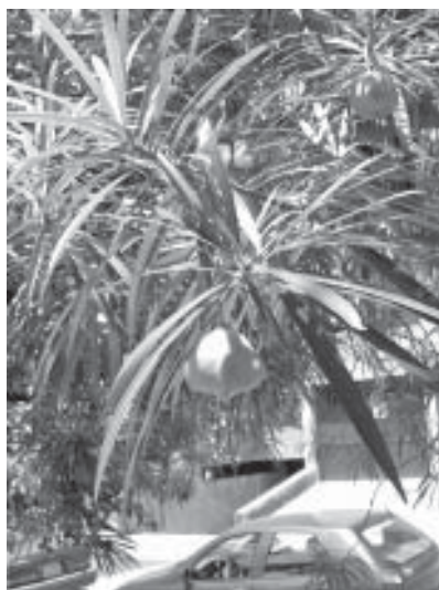
Cobolongo Thevetia nerifolia .