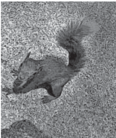
Ardilla Sciurus aestuans

Los corredores biológicos de una ciudad pueden ser, además de sus rondas hídricas; sus calles, avenidas y parques. Pero si esos espacios urbanos están plantados con especies que no ofrecen alimento a la fauna, no la atraerán, y en consecuencia, no serán verdaderos corredores biológicos. Serán espacios verdes para la circulación de carros y peatones, mas no para la circulación de las aves ni las semillas que ellas transportan. No serán corredores biológicos que conecten los ecosistemas fragmentados por la ciudad, por donde puedan circular los pájaros, los loros o las ardillas; serán simples calles bien arborizadas desde el punto de vista exclusivo de una de las especies que habita en el territorio, es decir: los seres humanos. Las arborizaciones que parten de criterios paisajistas o de servicios ambientales (exclusivos para los ciudadanos) olvidan que las funciones que la fauna nativa desempeña, a nivel de la polinización y dispersión de semillas, son las que aseguran la reproducción de la flora local y la conservación de los ecosistemas.