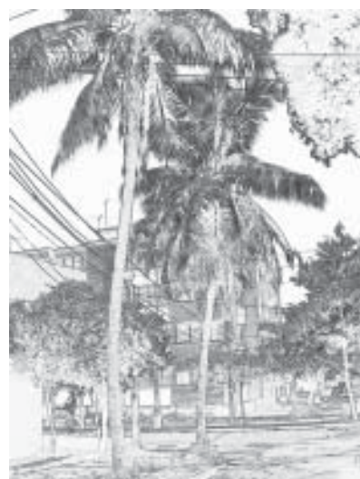
Palma de coco Cocos nucifera

En los espacios urbanos de uso público se encuentran altas poblaciones de especies introducidas dentro de las que se destacan, en primer lugar las que producen sombra, como el almendrón Terminalia catappa , la acacia amarilla Cassia siamea , el ficus Ficus benjamina , el caucho común Ficus elastica y la pata de vaca Bauhinia purpúrea (todas de Asia); en segundo lugar las que se caracterizan por la belleza de sus flores como el mión Spathodea campanulata , de África, el lluvia de oro Cassia fistula , de Asia, además del carbonero blanco Calliandra abematocephala del Brasil; el pomarroso brasileño Syzygium malaccense , que en realidad es del archipiélago Malayo; y la acacia roja Delonix regia , de Madagascar; o por la belleza de sus hojas, como el caucho lira Ficus lyrata , del trópico africano o el ceibo dominico Eritrina indica , de las islas del Pacífico sur; en tercer lugar las que producen alimento, como el árbol del pan Artocarpus cummunis y el mango Manguiífera indica , las dos del Asia, y en cuarto lugar, por su fama de árbol descontaminador: el oití Licania tomentosa , del Brasil, especie que predomina en la ciudad.