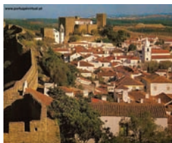
Vila de Óbidos (Óbidos)

09H30/10H30 – Visita de orientação e tempo livre em Óbidos.