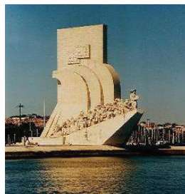
Padrão dos Descobrimentos (Lisboa)

14H50/15H00 – Deslocação até ao Mosteiro dos Jerónimos. 15H00/15H45 – Visita da Igreja e Claustros do Mosteiro dos Jerónimos. 15H45/16H00 – Deslocação até ao Museu dos Coches. 16H00/16H30 – Visita do Museu dos Coches. 16H30/16H45 – Deslocação até aos Pastéis de Belém.