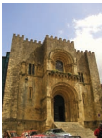
Sé Velha (Coimbra)

12H00/12H20 – Visita da Sé Velha. 12H20/12H45 – Deslocação até ao Restaurante Dom Pedro. 12H45/14H15 – Almoço. 14H15/14H30 – Deslocação até à Igreja de Santa Cruz. 14H30/15H00 – Visita da Igreja e Claustros de Santa Cruz.