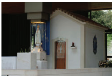
Capelinha das Aparições (Fátima/Ourém)

16H00/18H30 – Tempo Livre (possibilidade de comprar e benzer objectos religiosos).