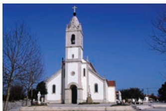
Igreja Paroquial (Fátima/Ourém)

15H00/16H00 – Missa na Capelinha das Aparições.