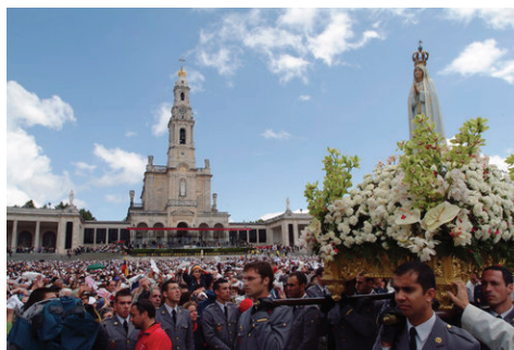
Cerimónias de 13 de Outubro (Fátima/Ourém)