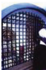
Igreja do Carmelo (Coimbra)

08H00/09H15 – Trajecto Fátima/Coimbra. 09H15/10H15 – Visita e Celebração Religiosa na Igreja do Carmelo de Santa Teresa (última morada da Irmã Lúcia). 10H15/10H30 – Trajecto Carmelo/Universidade.