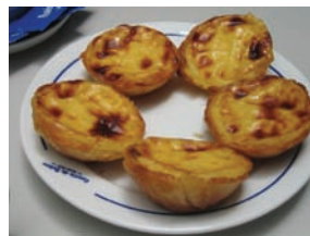
Pastéis de Belém (Lisboa)

16H45/17H30 – Comfort Stop nos Pastéis de Belém (com reserva de mesas).