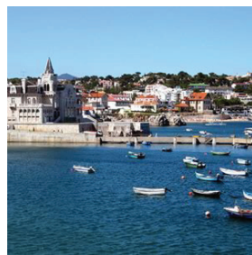
Vista da Cidadela (Cascais)

16H45/17H15 – Trajecto Cabo da Roca / Cascais (com passagem pelo Guincho). 17H15/17H30 – Paragem para fotos junto à Cidadela. 17H30/18H30 – Cascais/Hotel (via Av. Marginal).