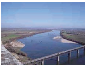
Vista das Portas do Sol (Santarém)