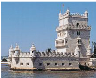
Torre de Belém (Lisboa)

12H00/12H30 – Trajecto Cristo-Rei/ Belém – Restaurante Caseiro. 12H30/14H00 – Almoço. 14H00/14H15 – Trajecto Restaurante/Torre de Belém. 14H15/14H30 – Paragem na Torre de Belém. 14H30/14H35 – Trajecto Torre de Belém/Padrão dos Descobrimentos. 14H35/14H50 – Paragem no Padrão dos Descobrimentos.