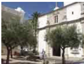
Igreja Santíssimo Milagre (Santarém)

14H15/15H30 – Passeio em Santarém (incluindo a visita das Portas do Sol, Igreja da Graça, Igreja de Marvila, a passagem pela Torre das Cabaças, Igreja de São João de Alporão, Sé e Mercado Municipal).