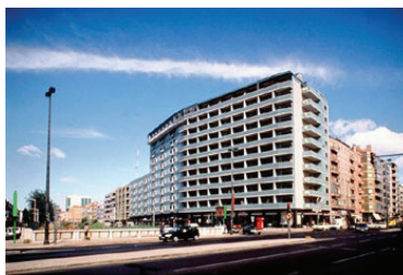
Hotel Roma (Lisboa)

17H30/18H00 – Trajecto Belém/Hotel. 19H30/20H00 – Recitação do Terço (em sala reservada no hotel para o efeito). 20H00 - Jantar no Hotel.