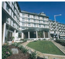
Hotel Cinquentenário (Fátima/ Ourém)

18H45/19H00 – Deslocação até ao Hotel. 19H00/19H15 – Check-in no Hotel Cinquentenário. 19H45/21H00 – Jantar no Hotel. 21H30/22H30 – Rosário e Procissão das Velas.