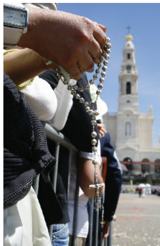
Cerimónias de 13 de Outubro (Fátima/Ourém)

Toda a Manhã - Celebrações de 13 de Outubro. 13H30/15H00 - Almoço no Hotel. 15H30/16H45 - Trajecto Fátima/ Aeroporto da Portela. 16H45/17H30 - Check-in no Voo TP552 (Lisboa / Munique). 19H05 - Partida do Voo TP552. Fim dos Serviços.