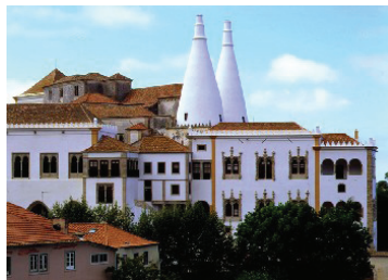
Palácio da Vila (Sintra)

14H45/15H45 – Visita do Palácio da Vila e Comfort Stop (possibilidade para provar a doçaria típica: queijadas e travesseiros).