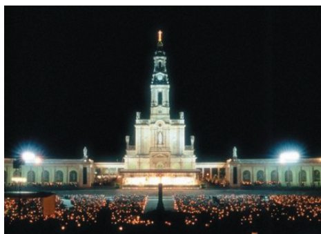
Celebrações Nocturnas (Fátima/Ourém)

16H15/17H15 – Trajecto Alcobaça/Fátima (com recitação do terço). 19H45/21H00 – Jantar no Hotel. Celebrações nocturnas de 12/13 de Outubro.