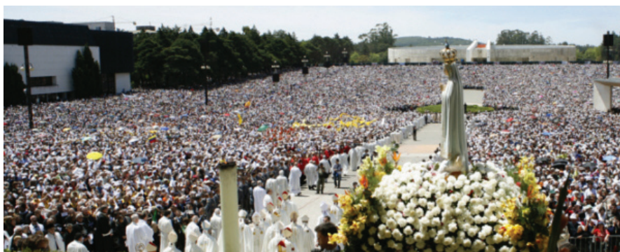
Cerimónias de 13 de Outubro (Fátima/Ourém)