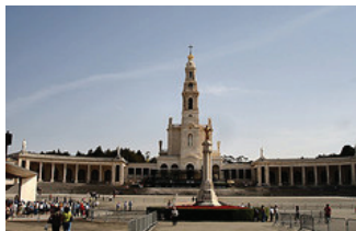
Santuário de Fátima (Fátima/ Ourém)

17H45/18H30 – Trajecto Tomar/Fátima - Cova da Iria (com recitação do terço). 18H30/18H45 – Paragem no topo da esplanada do Santuário (explicação sucinta sobre o significado e localização dos recursos com significado religioso).