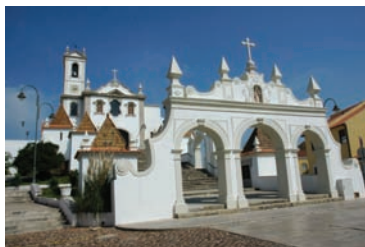
Igreja Santo António dos Olivais (Coimbra)

15H00/15H30 – Trajecto Igreja de Santa Cruz/Igreja de Santo António dos Olivais (local onde o Santo terá vivido como eremita). 15H30/16H00 – Visita da Igreja de Santo António dos Olivais. 16H00/16H15 – Trajecto Santo António dos Olivais/Igreja de Santa Clara-a-Nova.