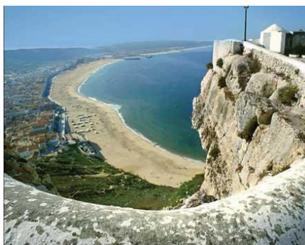
Vista do Sítio (Nazaré)

12H45/14H45 – Almoço no Restaurante São Miguel e tempo livre.