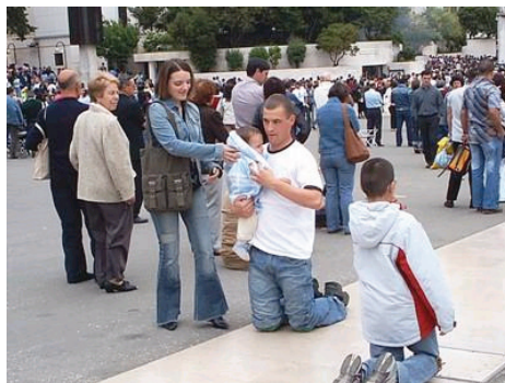
Pagamento de Promessas (Fátima/Ourém)

21H30/22H30 – Rosário e Procissão das Velas.