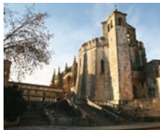
Convento de Cristo (Tomar)

15H30/16H30 – Trajecto Santarém/Tomar. 16H30/17H45 – Visita do Convento de Cristo e Comfort Stop.