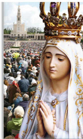
Cerimónias de 13 de Outubro (Fátima/Ourém)

Toda a Manhã - Celebrações de 13 de Outubro. 13H30/15H00 - Almoço no Hotel. 15H30/16H45 - Trajecto Fátima/ Aeroporto da Portela. 16H45/17H30 - Check-in no Voo TP552 (Lisboa / Munique). 19H05 - Partida do Voo TP552. Fim dos Serviços.