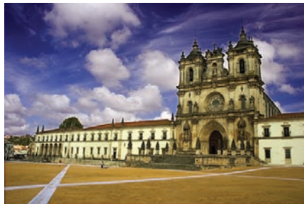
Mosteiro de Alcobaça (Alcobaça)

14H45/15H15 – Trajecto Nazaré/Alcobaça. 15H15/16H15 – Visita do Mosteiro de Alcobaça e Comfort Stop.