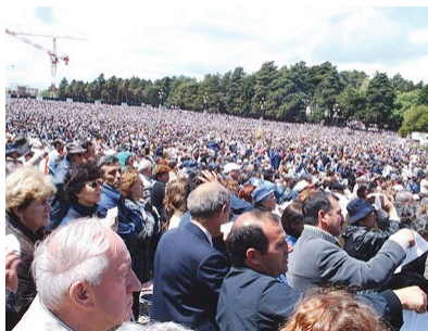
Cerimónias de 13 de Outubro (Fátima/Ourém)