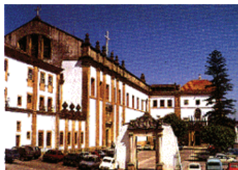
Igreja Santa Clara-a-Nova (Coimbra)

21H30 – Procissão das Velas e do Santíssimo (às quintas).