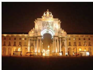
Praça do Comércio (Lisboa)

19H30/20H00 – Recitação do Terço (em sala reservada no hotel para o efeito). 20H00 – Partida para Nocturna de Fados. 20H00/20H30 – Panorâmica de Lisboa à Noite e trajecto até ao Bairro Alto (Largo Trindade Coelho).