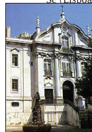
Igreja Santo António(Lisboa)

11H10/11H15 – Deslocação até à Igreja de Santo António. 11H15/12H15 – Visita da Igreja, da Cripta (lugar de nascimento do Santo) e Celebração Religiosa.