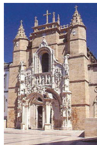
Igreja Santa Cruz (Coimbra)

15H00/15H30 – Trajecto Igreja de Santa Cruz/Igreja de Santo António dos Olivais (local onde o Santo terá vivido como eremita). 15H30/16H00 – Visita da Igreja de Santo António dos Olivais. 16H00/16H15 – Trajecto Santo António dos Olivais/Igreja de Santa Clara-a-Nova.