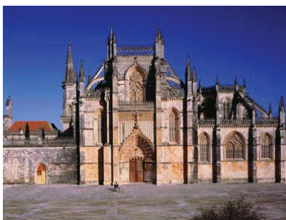
Mosteiro da Batalha (Batalha)

10H30/11H15 – Trajecto Batalha/Nazaré (Sítio).