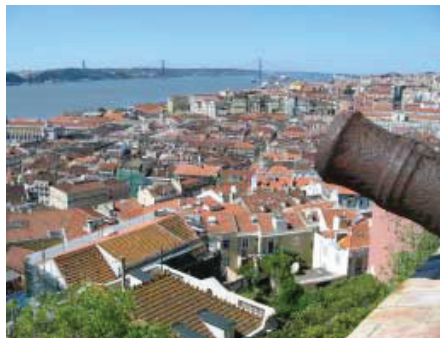
Vista do Castelo de São Jorge (Lisboa)

09H30/09H45 – Deslocação até ao Castelo de São Jorge. 09H45/10H30 – Visita do Castelo de São Jorge e Comfort Stop.