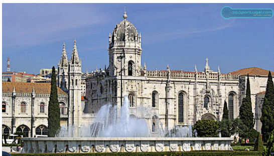
Mosteiro dos Jerónimos (Lisboa)

14H50/15H00 – Deslocação até ao Mosteiro dos Jerónimos. 15H00/15H45 – Visita da Igreja e Claustros do Mosteiro dos Jerónimos. 15H45/16H00 – Deslocação até ao Museu dos Coches. 16H00/16H30 – Visita do Museu dos Coches. 16H30/16H45 – Deslocação até aos Pastéis de Belém.