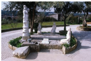
Poço do Arneiro (Fátima/Ourém)

11H00/12H00 – Visita da Casa de Francisco e Jacinta Marto, da Casa de Lúcia dos Santos e do Poço do Arneiro.