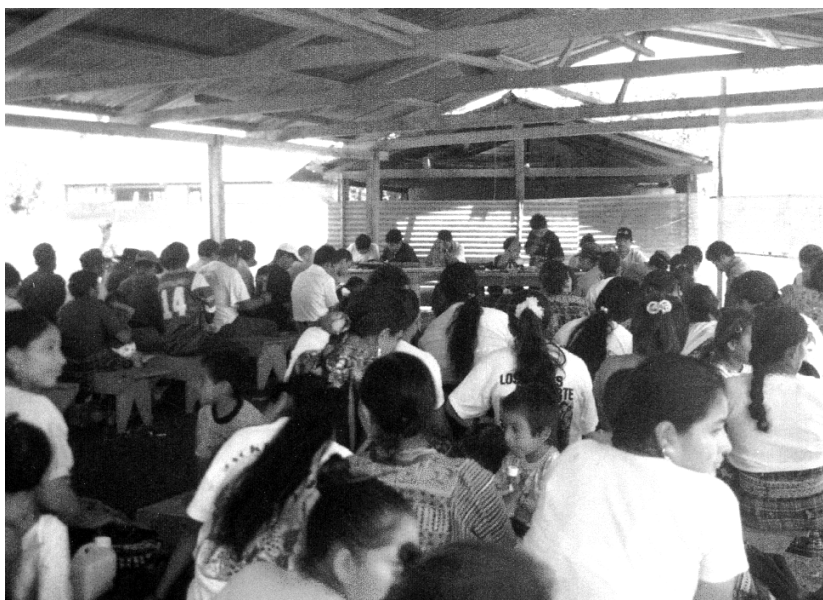
Ilustración 4. Asamblea comunitaria de Primavera del Ixcán, Sector II. Agosto 1999

Por último, en la «Declaración de las comunidades y organizaciones sociales de Ixcán con motivo del día mundial de los pueblos indígenas en defensa de la tierra y los recursos naturales» (Ixcán, 9 de agosto de 2008), se puede corroborar que la población indígena del Ixcán está pendiente de las cuestiones políticas y culturales, las amenazas a sus tierras y las consecuencias de las políticas municipalistas.