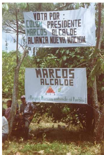
Ilustración 3: Pancartas por la visita de Álvaro Colom a Primavera del Ixcán, agosto 1999

Pero en el 2000, ocurrió algo que dio una luz de esperanza al proceso: asumió la alcaldía municipal un representante de las Comunidades de Población en Resistencia, CPR, y fue desde ahí que se empezó a escribir otra parte de la Historia (SERJUS 2009:36)