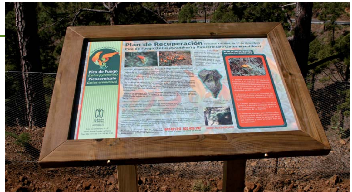
Mesa interpretativa de las actuaciones de protección y reforzamiento de las poblaciones de pico de fuego ( Lotus pyranthus ) en el barranco de Olén.