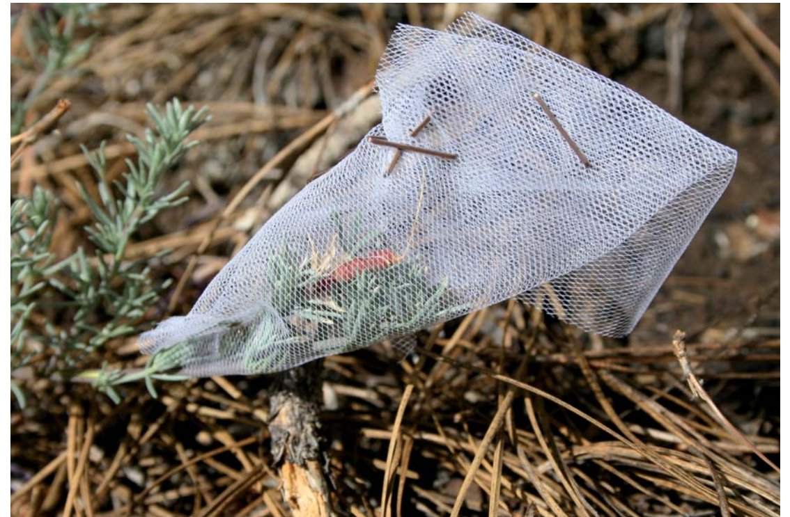
Trampa para la recolección de semillas de pico de fuego ( Lotus pyranthus ).

jornadas formativas sobre “Identificación de especies de Lotus amenazados de Canarias”, sobre todo, debido a la presencia en La Palma de ejemplares ajardinados de pico de paloma ( Lotus berthelotii ) y pico de El Sauzal ( Lotus maculatus ), endémicos de Tenerife, así como de sus híbridos. Se consideró importante formar al personal de Medio Ambiente en su identificación, con el fin de localizar a todos los ejemplares de este género que estuviesen presentes en jardines públicos y particulares de nuestra isla. De esta manera sería posible detectar problemas de conservación derivados de la cercanía de estos individuos foráneos a las poblaciones naturales de las especies endémicas de la isla de La Palma.