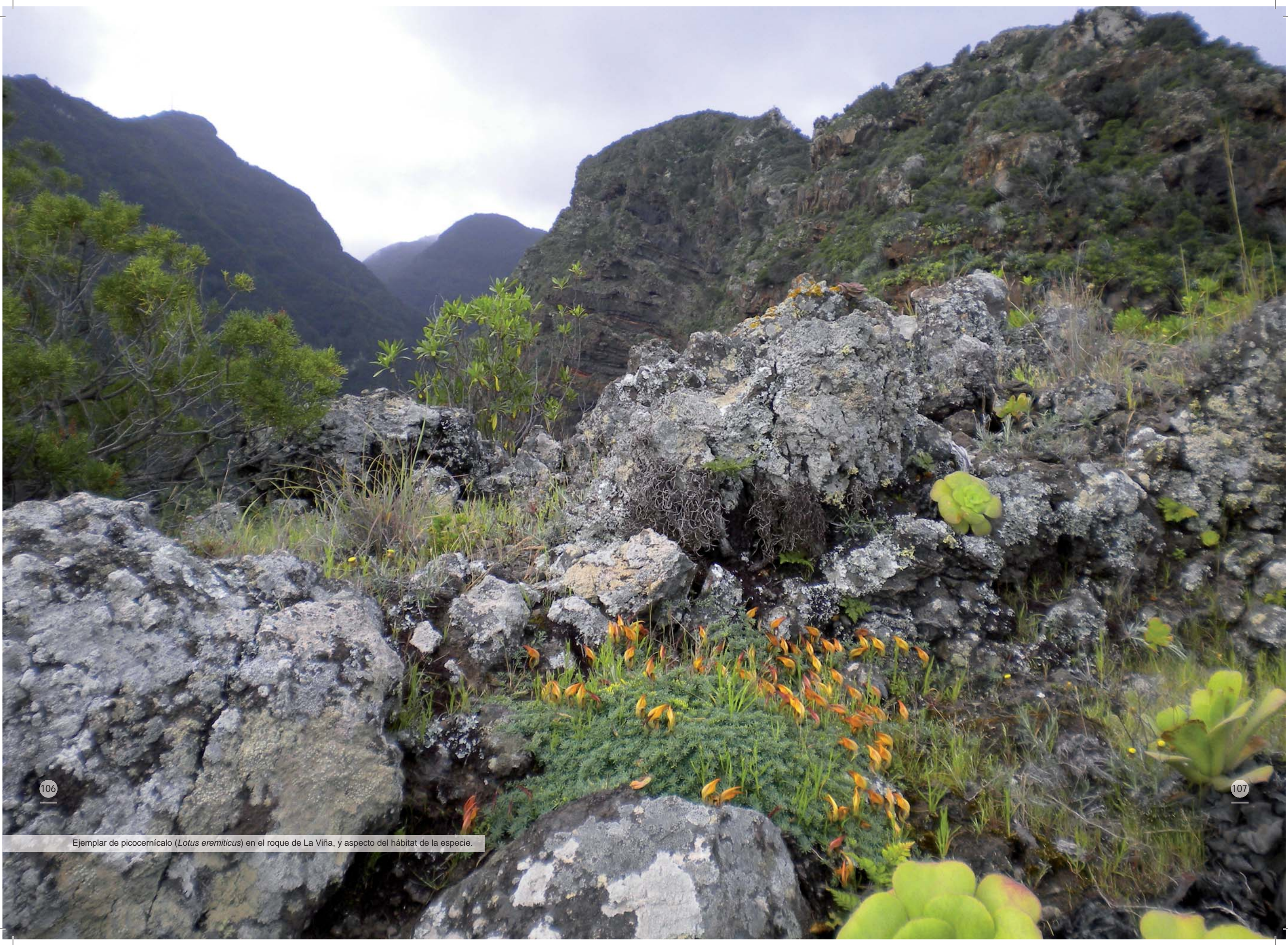
Ejemplar de picocernícalo ( Lotus eremiticus ) en el roque de La Viña, y aspecto del hábitat de la especie.