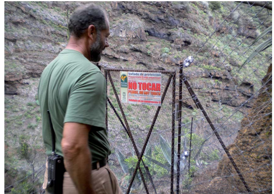
Colocación del vallado de protección y señalización en el roque de La Viña.