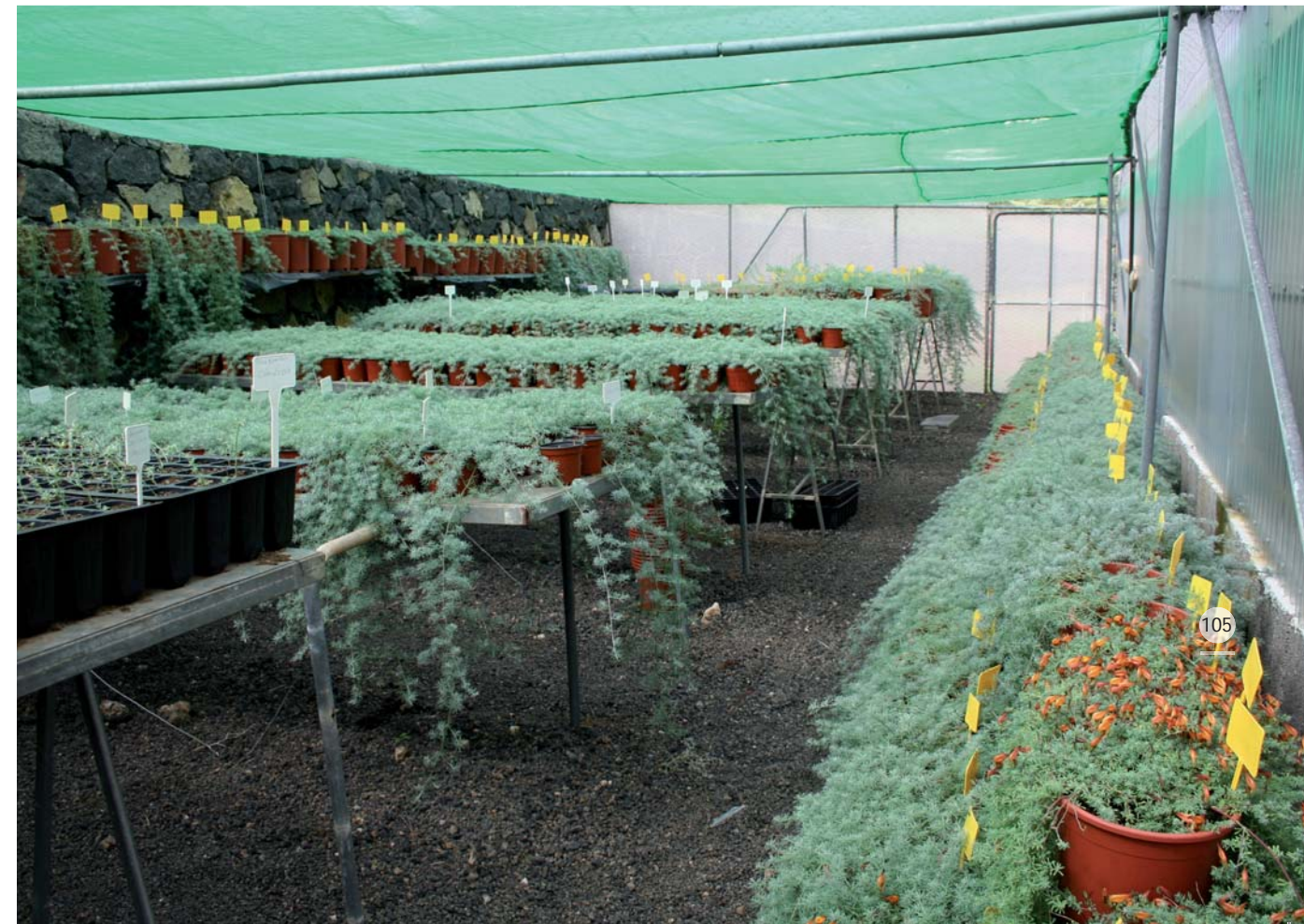
Ejemplares de ambas especies mantenidos en stock en el Vivero de Flora Autóctona del Cabildo Insular de La Palma.

Para el reforzamiento de las poblaciones realizado hasta ahora solo se han utilizado individuos provenientes de esquejes, debido a que el objetivo inicial era el de replicar todas las poblaciones existentes y salvaguardar la mayor variabilidad genética posible ante cualquier factor incontrolado que amenazara la integridad de los ejemplares naturales. Con respecto al pico de fuego, se han llevado a cabo varias plantaciones, coincidiendo con los meses de primavera y otoño. En total se han incorporado al medio 1.455 ejemplares convenientemente identificados, de ma-