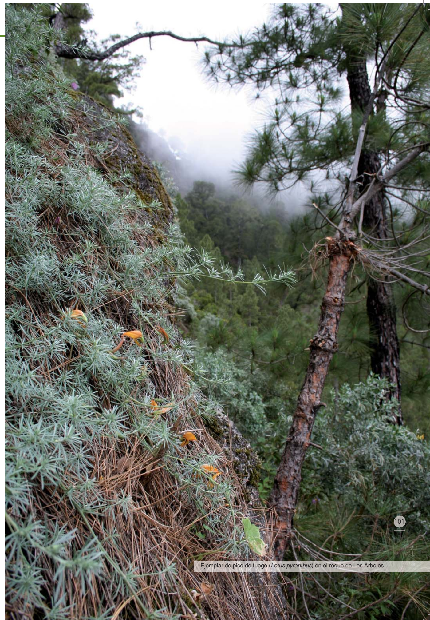
Ejemplar de pico de fuego ( Lotus pyranthus ) en el roque de Los Árboles