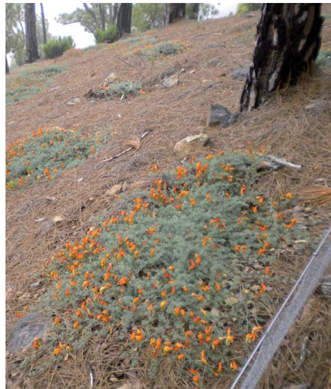
Resultado de las plantaciones realizadas dentro de los vallados ubicados en el lomo de La Monja.