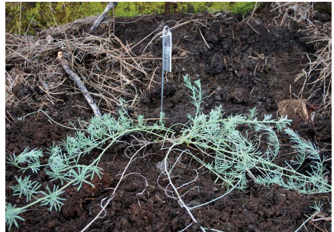
Marcaje de los individuos incorporados al medio como reforzamiento de la población.