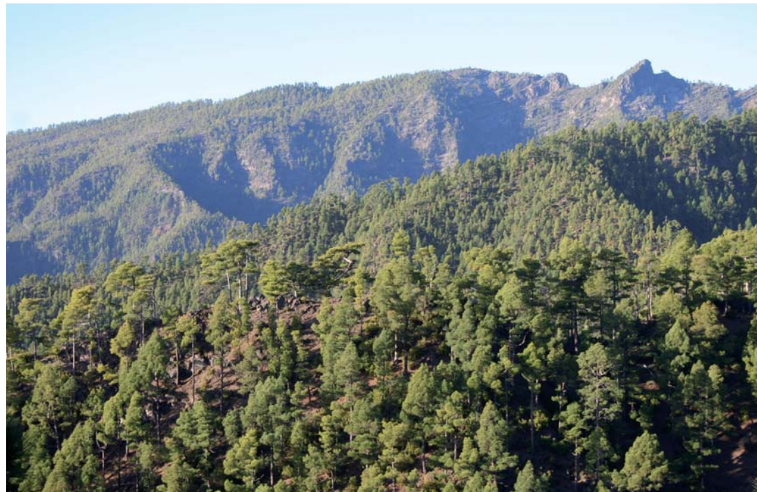
Pinar canario, hábitat del pico de fuego ( Lotus pyranthus ).

Sin embargo, no es hasta principios del año 2008 cuando el Cabildo Insular de La Palma, a través de su Consejería de Medio Ambiente, toma la decisión de poner en marcha dicho plan de recuperación. Para ello organizó el “I Workshop para la conservación del pico de fuego ( Lotus pyranthus ) y del picocernícalo ( Lotus eremiticus )”, celebrado en Santa Cruz de La Palma ese año. En él participaron numerosos investigadores, científicos y conservacionistas de todo el archipiélago y pertenecientes a las más diversas