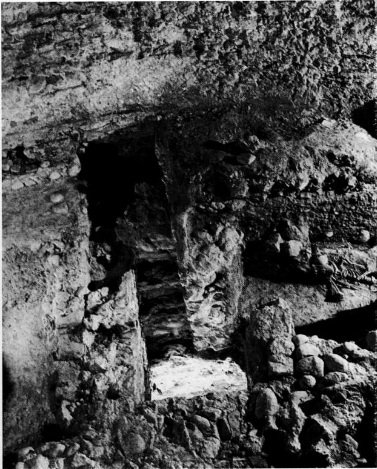
A la dreta de la fotografia, restes humanes aparegudes sota el paviment de l'edific de la cúpula de Centcelles. Imatge de l'Institut Arqueològic Alemany, reproduïda del llibre Informe preliminar sobre los trabajos realizados en Centcelles , de Helmut SCHLUNK i Theodor HAUSCHILD (1962).