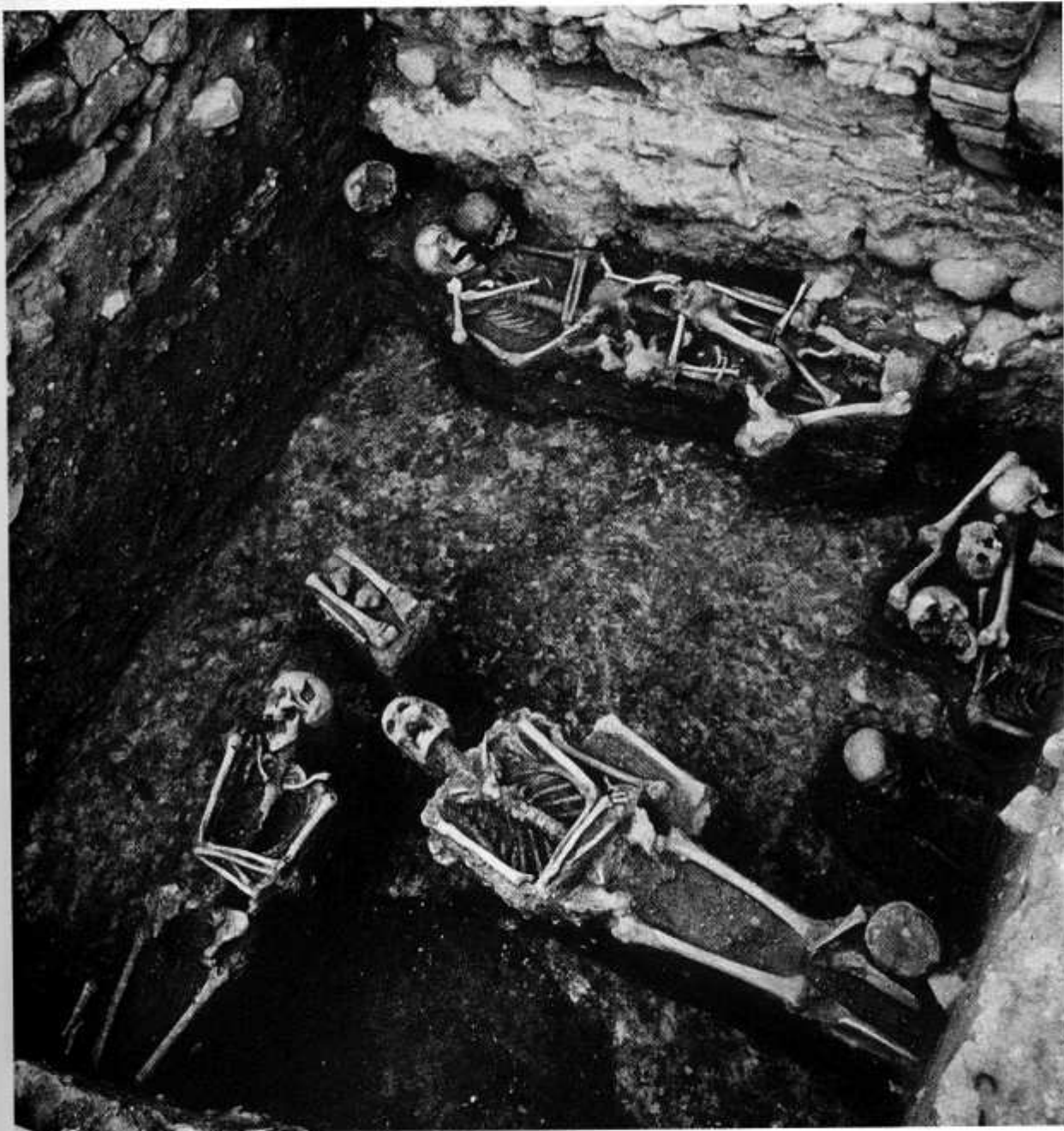
Enterraments d'inhumació localitzats davant de l'entrada a l'edifici de la cúpula de Centelles.