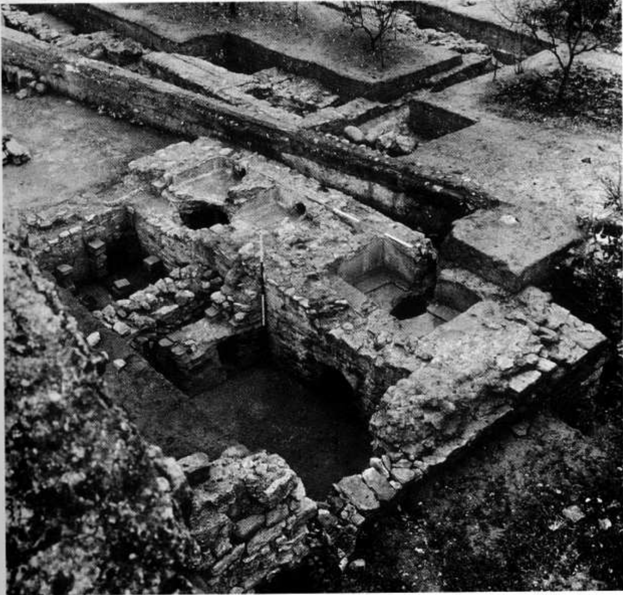
Detall dels banys del sector occidental de la vil·la de Centcelles.