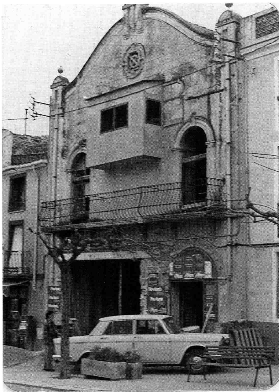
La casa del delme ocupava el solar on avui està situat el Sindicat