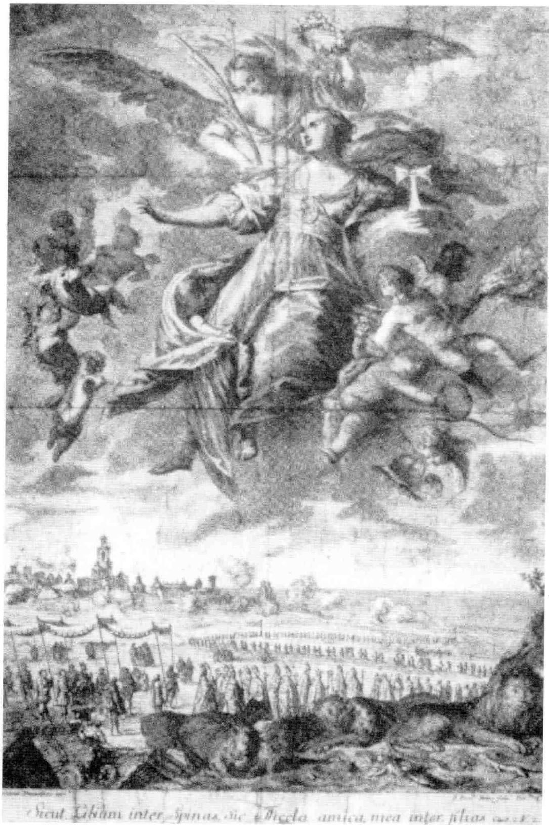
Quadre en honor de Santa Tecla (segle XVIII).