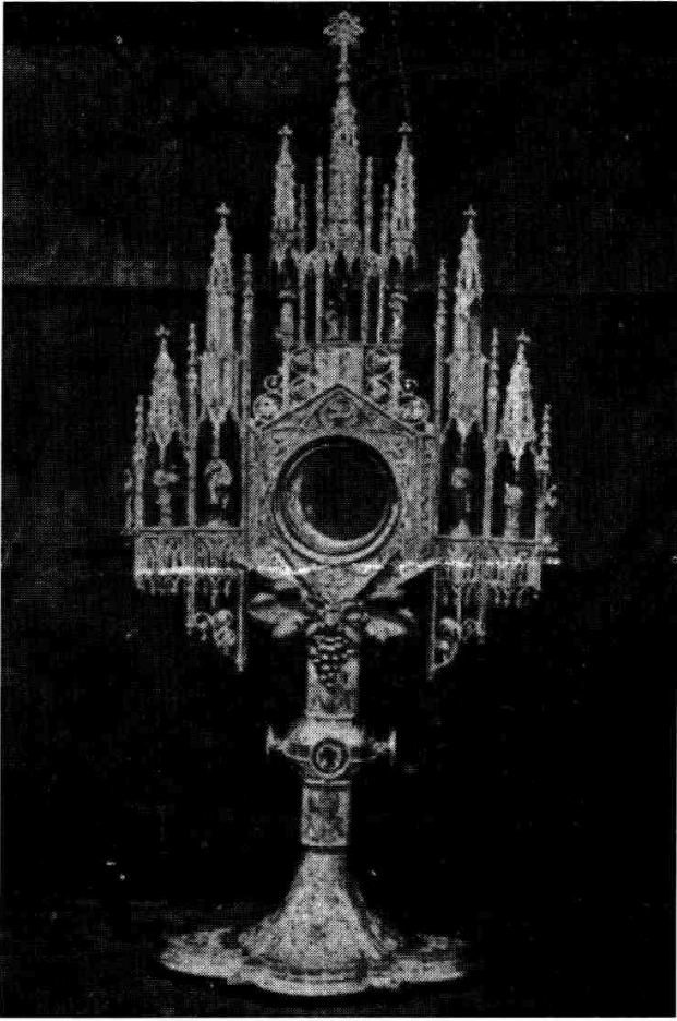
La Custòdia de la Parròquia (1918)