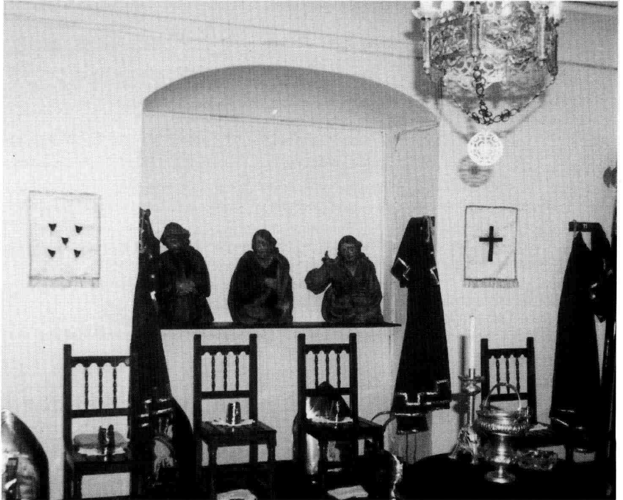
Al centre de la fotografia, les tres peces escultòriques que va tornar el Museu de Reus l'any 1940, actualment exposades al petit museu parroquial de Constantí.