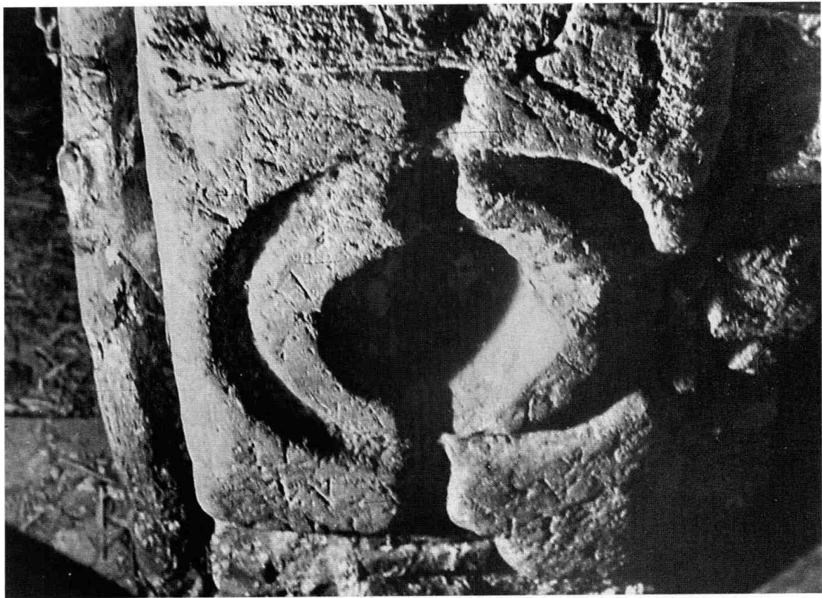
La inscripció RIT 913, quan era encastada a una casa del carrer de Montserrat (Reus).