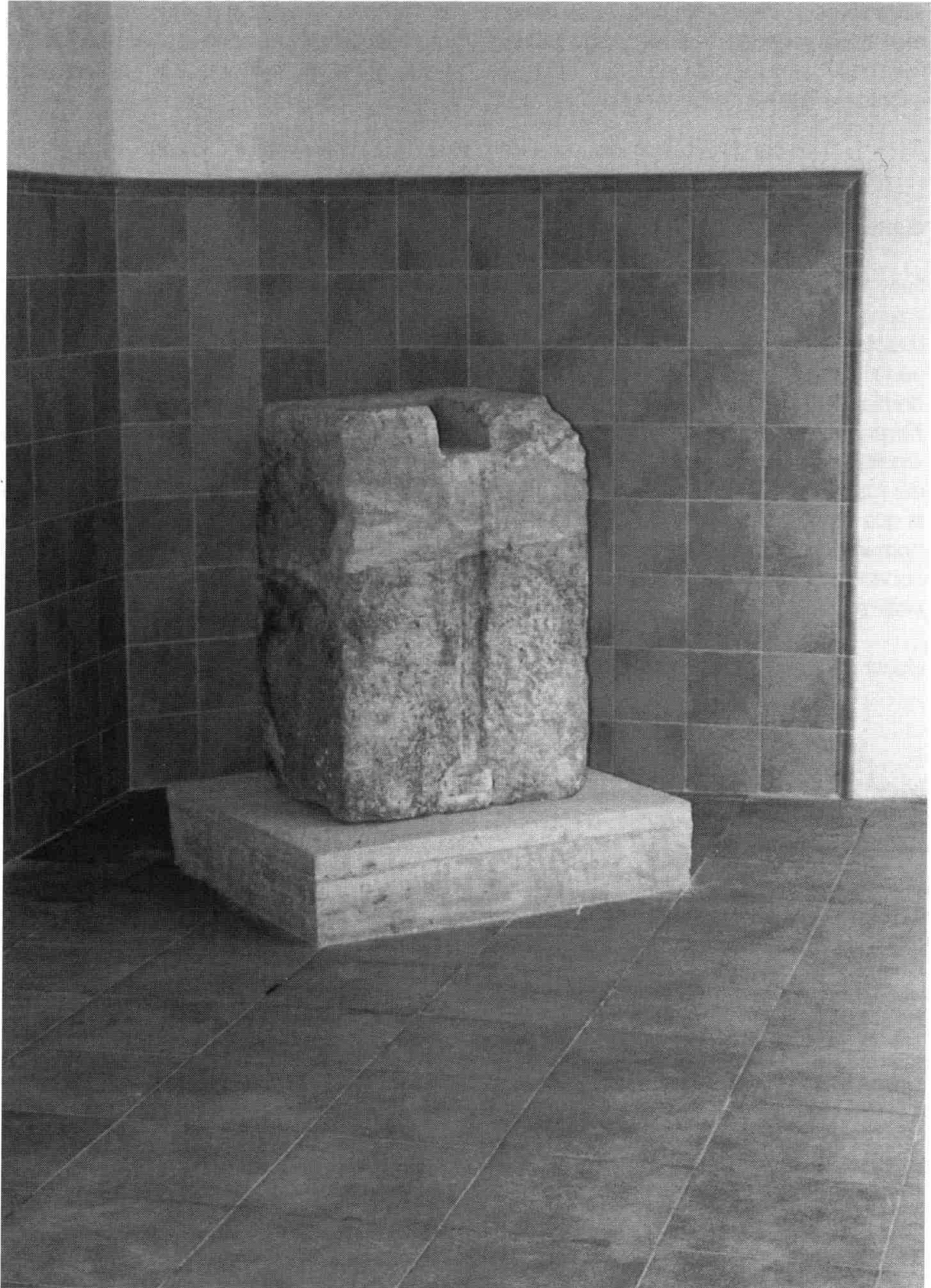
El pedestal RIT 383, ja instal·lat a cal Brunet. Foto: Josep M. Sabaté (2002).