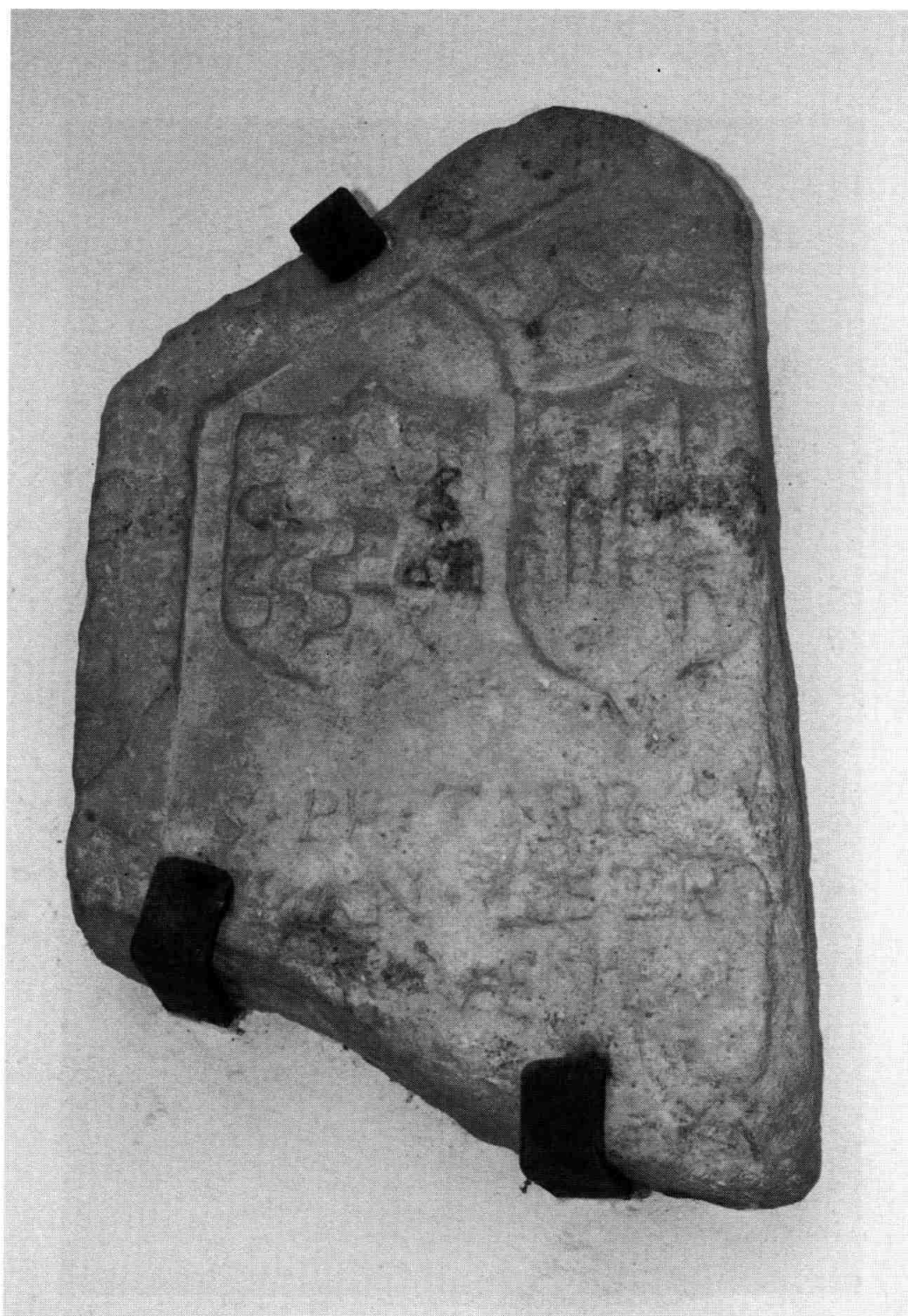
La làpida amb els escuts d'època moderna, subjectada a la paret de cal Brunet. Foto: Josep M. Sabaté (2002).