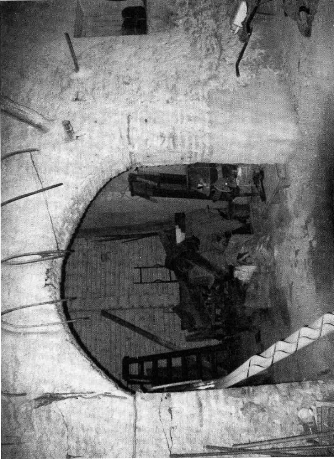
Arcada del magatzem del carrer Major. El pedestal RIT 383 era al peu del pilar de la dreta. Foto: Josep M. Sabaté (2002).