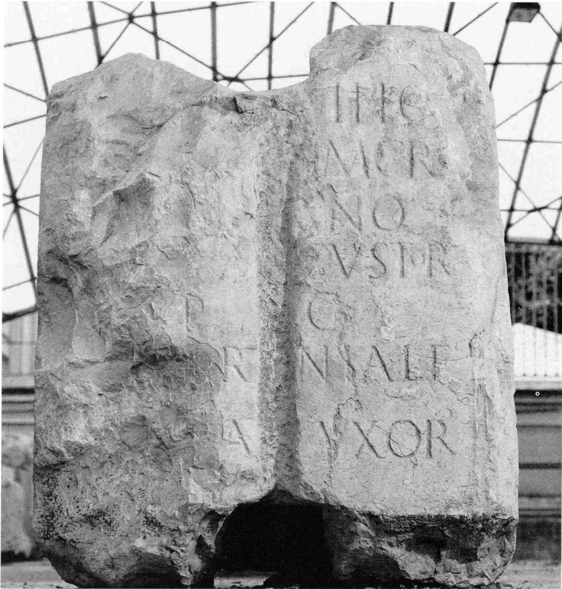
La inscripció MNAT 45122, procedents dels afores de Tarragona.