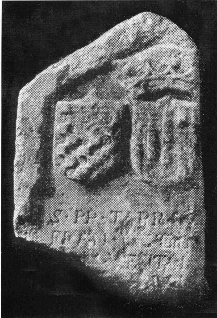
Fragment de làpida, amb escuts de final del segle XVI, conservat a cal Brunet. Foto: Isidre Valentines ( Boletín Arqueológico , 1949).