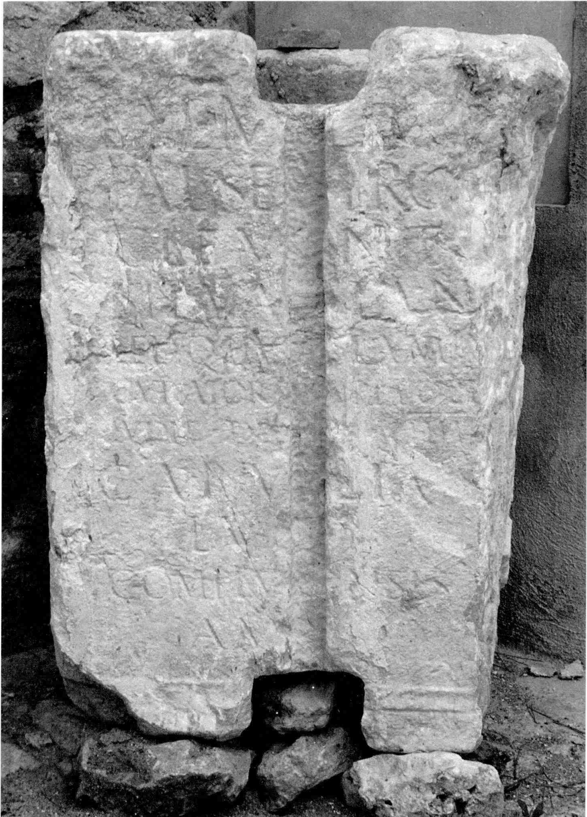
La inscripció RIT 922, localitzada a l'església de de Monnars.