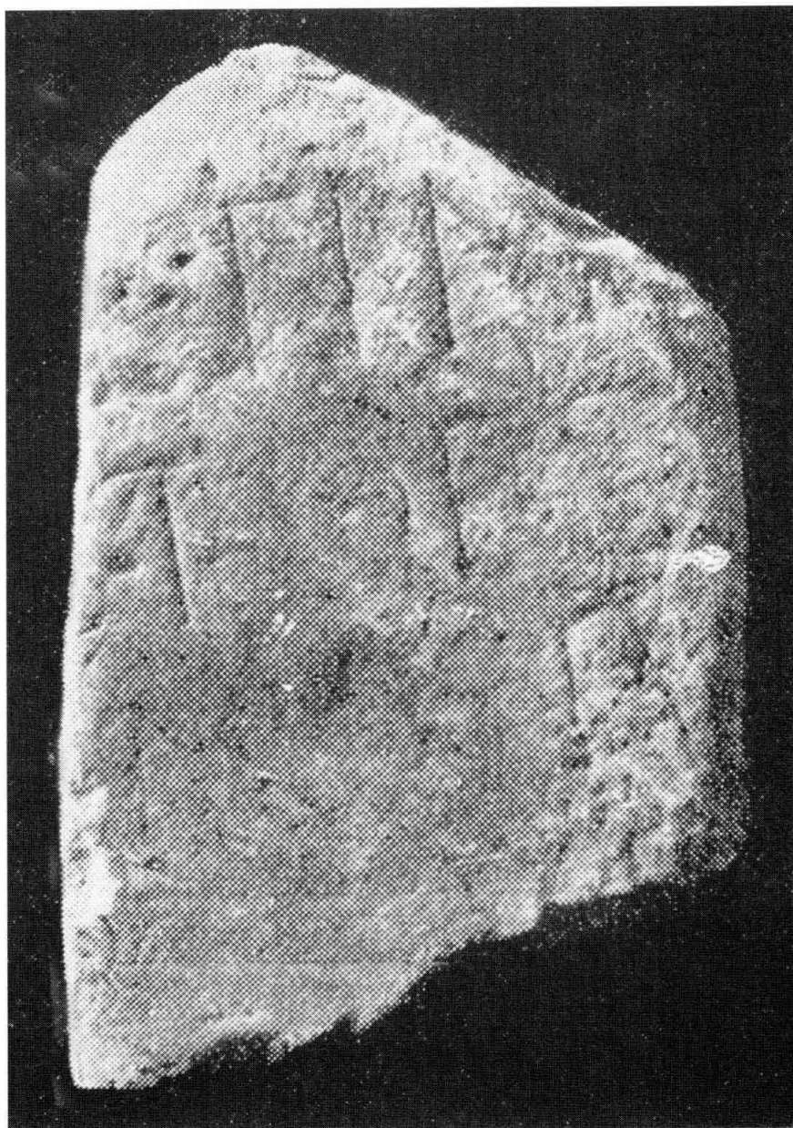
Cara posterior de la làpida anterior, amb possible inscripció romana.