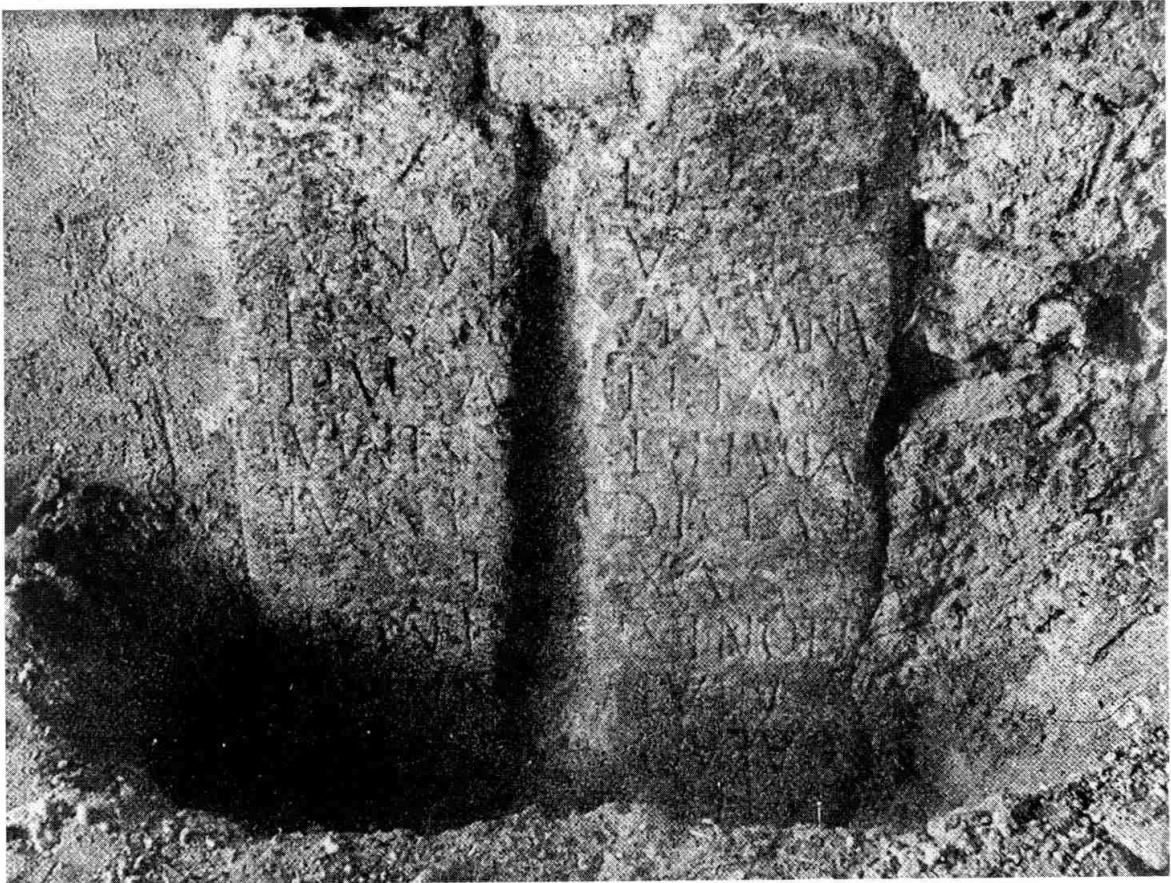
La inscripció RIT 383, quan encara era encastada al pilar de l'arcada.