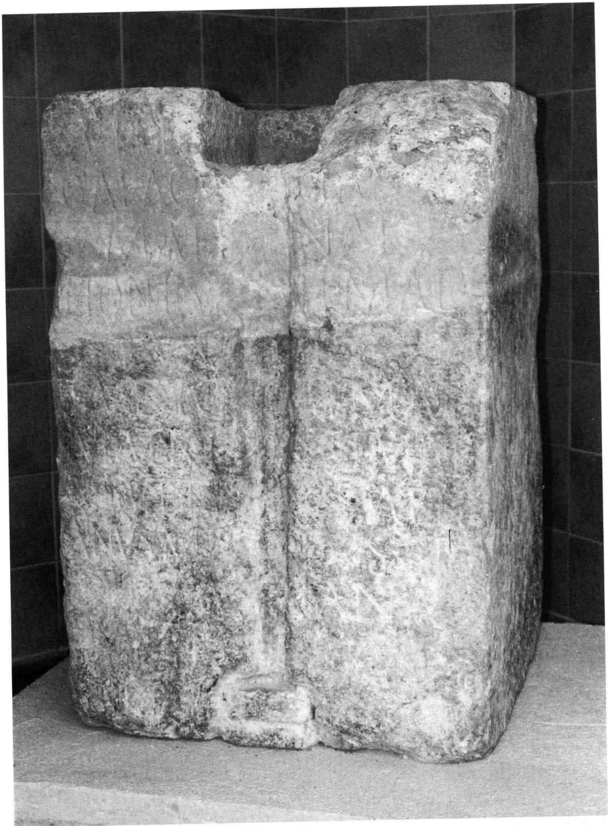
El pedestal RIT 383. Es distingeix clarament la part (ara, la superior) que era parcialment enterrada.