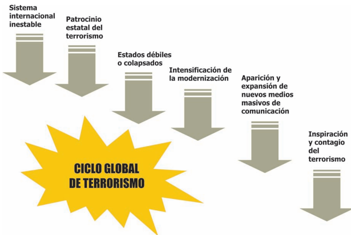
Gráfico 2. Catalizadores de los ciclos globales de terrorismo (elaboración propia).

satisfacer por completo a cada miembro del sistema internacional; cuando mejor funciona es cuando mantiene la insatisfacción por debajo del nivel en que la parte ofendida trataría de alterar el orden internacional". Cuando aquí se hace referencia a la inestabilidad en la configuración del sistema internacional se quiere dar a entender, por lo tanto, una situación tal que puede llevar a que la parte o partes actualmente ofendidas con la distribución de poder en el sistema internacional (para emplear el lenguaje de Kissinger) se sienta(n) tentada(s) a desafiar el statu quo , por considerar que existen razones para apuntalar sus pretensiones en ese sentido, y oportunidades o perspectivas de éxito para los esfuerzos que emprendan en pos de su reconocimiento. O también, esa inestabilidad puede derivarse de cambios más