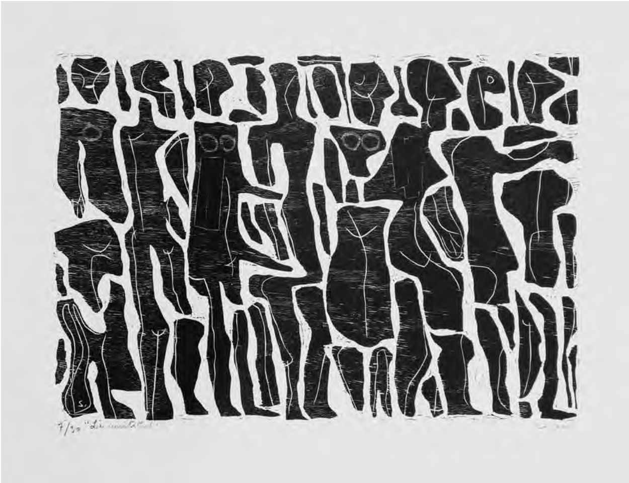
Luís Seoane, A multitude (1965). Gravado en madeira sobre papel.

alcánzase en realidade en Seoane mediante procedementos retabulares nos que as pezas son episodios tomados de diferentes momentos históricos e de variados destinos da emigración durante dous séculos. Promóvese así unha comprensión da emigración como constante histórica, se ben resulta difuminado o carácter coral e comunitario que exprese algo máis que o lamento e materialice unha acción política decidida. Compróbase no segundo poema da serie (Seoane 1989b: 68):