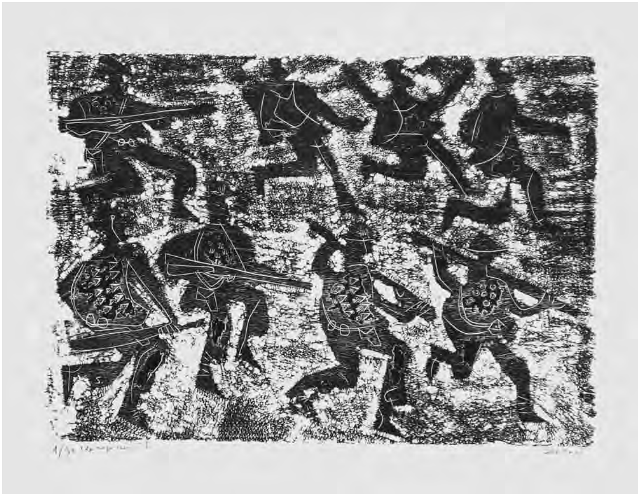
Luís Seoane, A represión I (1965). Gravado en madeira sobre papel.

Sublíñano os debuxos que acompañan os poemas do libro, todos eles referidos ao traxecto no barco que conduce aos emigrantes a través do Atlántico. Debuxos máis líricos ca épicos, con figuras entre a espera polo que virá e a saudade da patria abandonada acaso para sempre. Unha iconografía esta que sen dúbida ha lembrar aquela que recoñecemos como prototípica na pintura e nos gravados de Luís Seoane: unha figura, dúas, tres ás veces... quietas na contemplación, na lembranza, no ensoño ou na conversa.