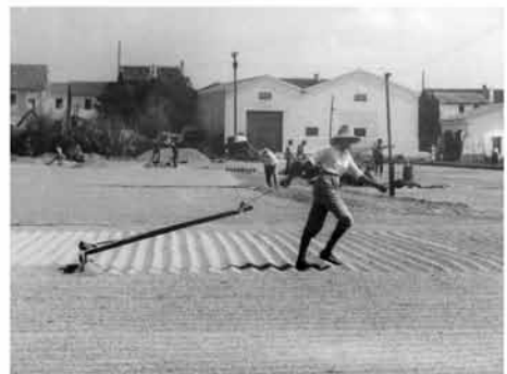
FIG. 1. Labores tradicionales antes del proceso de mecanización del sector; de izquierda a derecha, y de arriba abajo: labores de acondicionamiento del terreno; paso de la tabla fina niveladora; siembra de las planteras; plantación del arroz; abonado; siega trilladora ambulante; trabajos en el secadero.