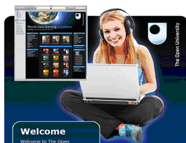
Figura 1 http://www.open.ac.uk/itunes/

Si una universidad intenta que se introduzca el podcasting en un número significativo de cátedras necesitará implementar una estrategia institucional para establecer el podcasting como servicio integral de su sistema de enseñanza. En general se ofrecen opciones tales como usar una plataforma comercial para distribuir los podcasts o elaborar un propio sitio web en las páginas de la universidad. Por ejemplo la Open University de Inglaterra se unió con iTunes University para ofrecer podcasts seleccionados a un público abierto ( http://www.open.ac.uk/itunes/ ).