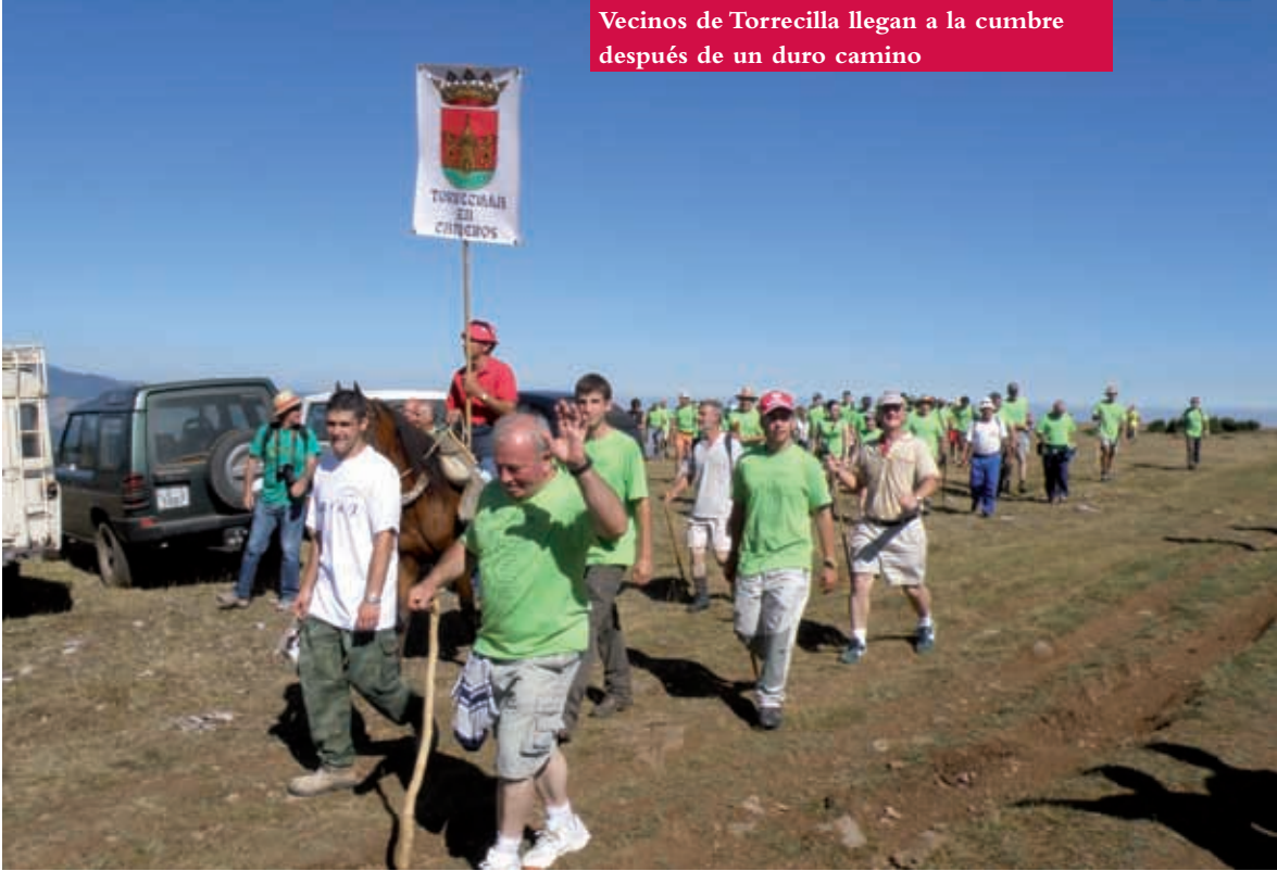
Vecinos de Torrecilla llegan a la cumbre después de un duro camino

los Ayuntamientos de dichos pueblos que cada año, codo con codo, trabajan en la organización del evento; enseguida comprendemos el por qué de esta iniciativa cuando leemos en su web lo siguiente: “este monte encerraba mil historias compartidas de pastores, leñadores, caminos a pie uniendo los dos valles del Iregua y Najerilla; peleas de pastos y ganado, almuerzos bajo la manta; nieve, mucha nieve y muchas penurias en otros tiempos, cuando al pueblo no se bajaba todos los días...” Esta parece ser la esencia de la fiesta: el recuerdo, la memoria de todas esas vidas que recorrieron aquellos caminos con el único objetivo de la supervivencia, de ganarse el pan de cada día sin importar cómo, soportando todo tipo de inclemencias y contratiempos.