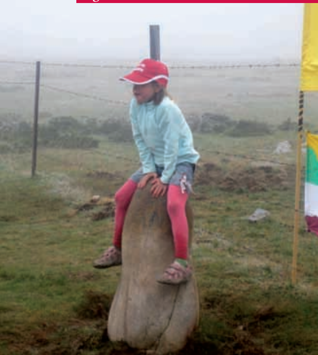
Una niña corona la piedra mormal a su llegada al Serradero

hacen un corro en torno a un abuelito que parece estar contando alguna historia interesante de su juventud: “los meses en que se hacía la trashumancia eran los que no tienen “r”, o sea: mayo, junio, julio y agosto; el resto no, por el frío y la nieve, claro”, es lo único que conseguí escuchar. Se consigue crear un ambiente de amistad, de respeto por las tradiciones y las costumbres ancestrales; once pueblos unidos por un lugar común cargado de gran significado y seguro, también, cargado de buenas vibraciones. Serán siempre conocidos como “los pueblos del Serradero”.