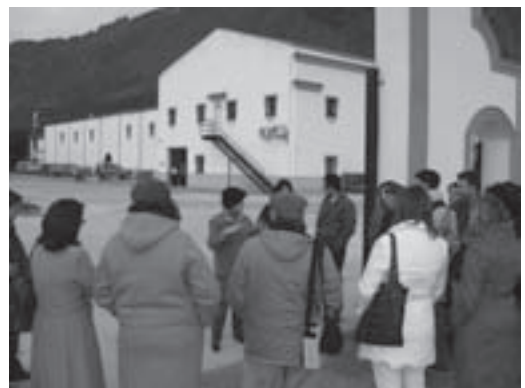
Imágenes 16: Seminario de Investigación Final en Bedmar (Jaén).

Este seminario fruto de la colaboración y coordinación de la ADR Sierra Mágina, el resto de GDRS participantes del proyecto, el Consejo Regulador de la Denominación de Origen de Sierra Mágina, la Universidad de Jaén y la Universidad Paris Diderot; se constituyó como un foro muy cualificado donde se trató el futuro del olivar desde el punto de vista de la sostenibilidad y sus recursos patrimoniales.