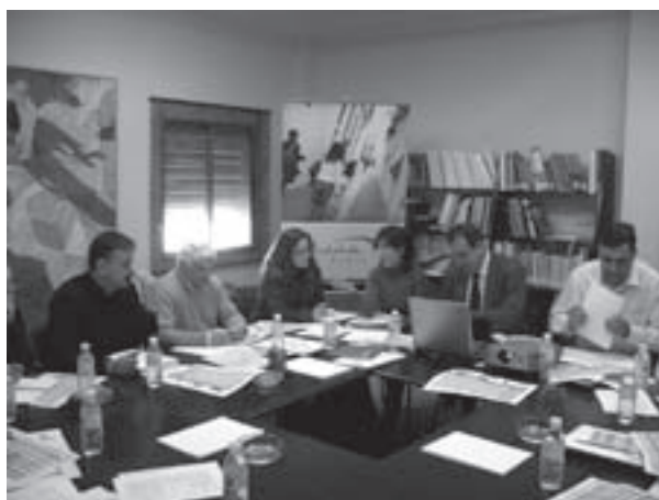
Imagen 3: Reunión de coordinación de la ACC NERA: Nueva Estrategia Rural de Andalucía.

de intervención desarrollado en las anteriores experiencias de desarrollo rural. Es decir, posee el mismo enfoque que el programa LEADER PLUS (enfoque ascendente, cooperación entre territorios e integración en red), que en Andalucía ha elevado la exigencia co-