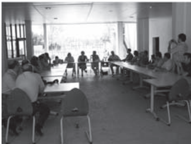
Imagen 13: Estancia de intercambio en la región Provence Alpes Côte d' Azul.

Esta actuación tuvo como principal objeto la visualización de ejemplos de Agrotiendas ya constituidas y establecidas en esta región francesa para promover el conocimiento mutuo de las comarcas olivares y el aprendizaje de la diversidad paisajística y patrimonial que existe en los diferentes territorios.