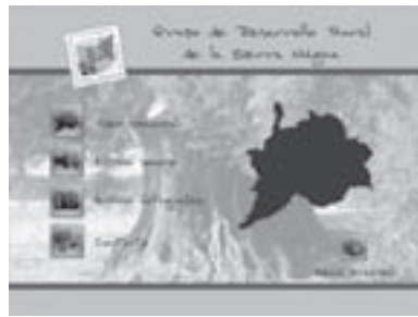
Imágenes 20: Menú principal y secundario del material audiovisual.