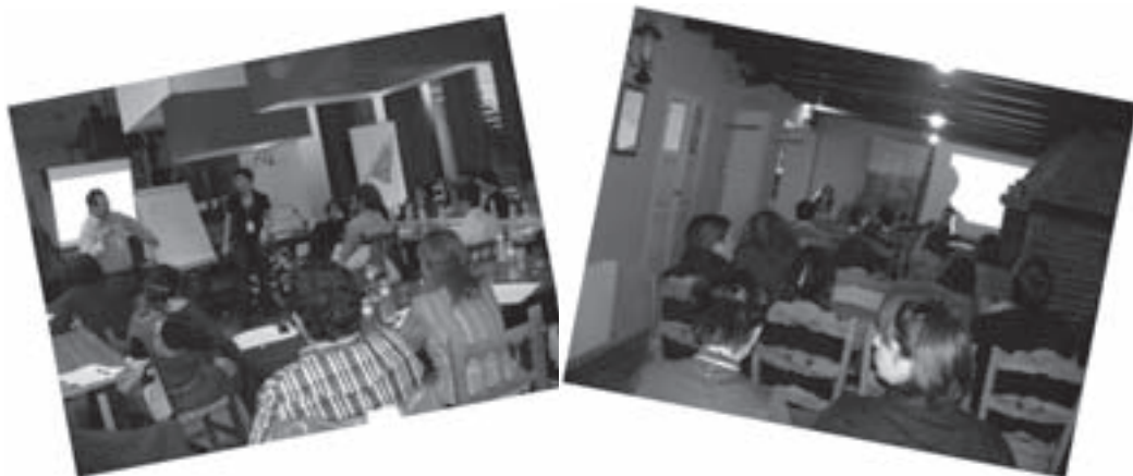
Imágenes 10: III Taller de participación estratégica celebrado en Vélez de Benaudalla (Granada).

Celebrado entre las localidades de Vélez de Benaudalla (Granada) y Tabernas (Almería) los pasados 23 y 24 de octubre de 2008.