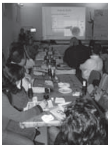
Imagen 14: Curso de cata de aceite en Baena (Córdoba).