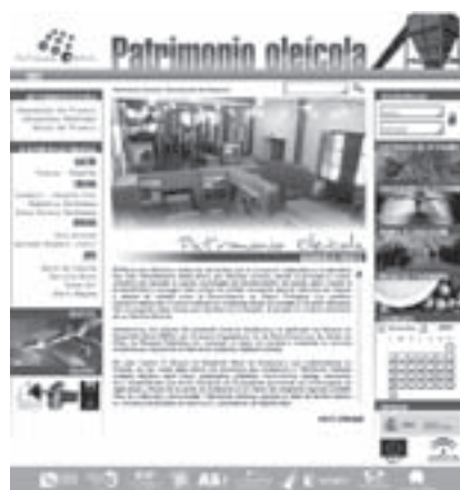
Imagen 15:

Esta actuación se ha desarrollado como herramienta de promoción y difusión de la cultura oleícola de las comarcas mediterráneas adheridas al proyecto.