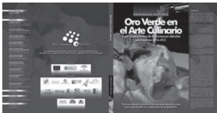
Imagen 18: Oro Verde en el Arte Culinario.

- “Oro Verde en el Arte Culinario”. Guía gastronómica de las comarcas oleícolas participantes en la ACC “Patrimonio oleícola y puesta en valor de aceites típicos en circuitos comerciales de radio corto: labelización de agrotiendas” .