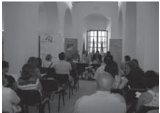
Imagen 8: I Taller de participación estratégica celebrado en Montoro (Córdoba).

Celebrado en la localidad de Montoro (Córdoba) el 18 de junio de 2008. El objetivo de este primer taller fue el de ampliar los conocimientos de las personas participantes en relación a las marcas de calidad y visualizar un primer ejemplo de agrotienda con el caso concreto de las Agrobotiques de Cataluña.