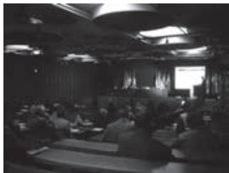
Imagen 24: Encuentro Euromediterráneo de la Enseñanza y Formación Agrícola.

Expoliva, celebrada en la ciudad de Jaén desde el 13 al 16 de mayo de 2009. En esta feria del olivar, el Grupo Coordinador del proyecto presentó una comunicación sobre las diferentes actuaciones desarrolladas en el marco del presente proyecto.