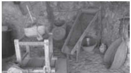
Imágenes 21: Fotogramas del material audiovisual oleícola.