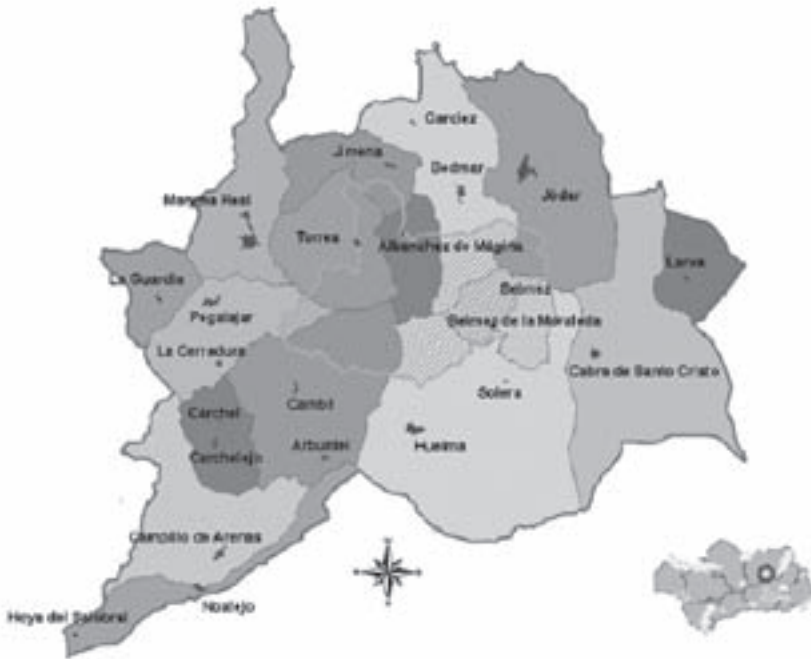
Imagen 1: Mapa de la comarca de Sierra Mágina.

de Albalánchez de Mágina, Bélmez de la Moraleda, Bedmar-Garciez, Cabra del Santo Cristo, Cambil-Arbuniel, Campillo de Arenas, Cárcheles (Carchel y Carchelejo), Huelma-Solera, La Guardia de Jaén, Larva, Jimena, Jódar, Noalejo-Hoya del Salobral, Pegalajar-La Cerradura y Torres, y como área de influencia al municipio de Mancha Real.