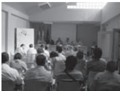
Imagen 9: II Taller de participación estratégica celebrado en Alcaudete (Jaén).

El objetivo de este segundo taller fue el de visualizar varios ejemplos de empresas similares a Agrotiendas que existen en nuestro territorio.