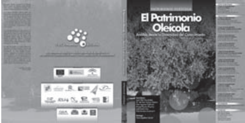
Imagen 19: El Patrimonio Oleícola: análisis desde la diversidad del conocimiento.

- “El Patrimonio Oleícola: Análisis desde la Diversidad del Conocimiento”.