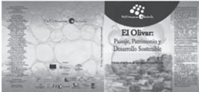
Imagen 22: El Olivar: Paisaje, Patrimonio y Desarrollo Sostenible.

Se han publicado los diferentes artículos desarrollados durante el Seminario de Investigación final celebrado durante los días 21, 22 y 23 de enero de 2009 en la localidad de Bedmar (Jaén).