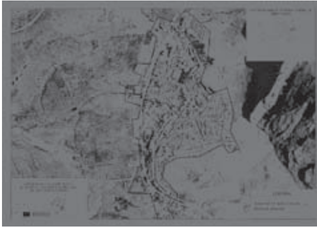
Imagen 7: Mapa extraído de la representación cartográfica de la ACC Patrimonio Oleícola.

Los elementos oleícolas inventariados en las 10 comarcas participantes de la ACC Patrimonio Oleícola se han trasladado a una base de representación cartográfica para poder ser consultada y utilizada.