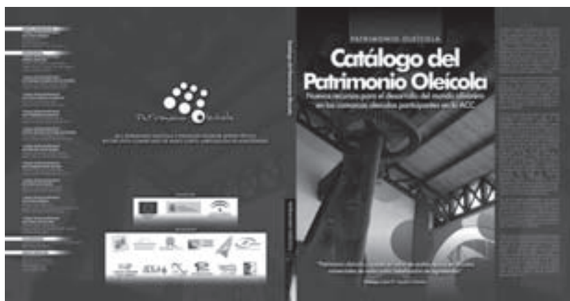
Imagen 17: Catálogo del Patrimonio Oleícola.

- “Catálogo del Patrimonio Oleícola”. Bienes inventariables de las comarcas oleícolas participantes en la ACC “Patrimonio oleícola y puesta en valor de aceites típicos en circuitos comerciales de radio corto: labelización de agrotiendas” .