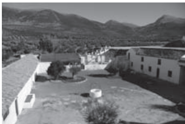
Imagen 2: Subvención concedida para ampliación y mejora de las infraestructuras turísticas de Sierra Mágina. Cortijo de Bornos en el municipio de Cambil.

Durante el marco de financiación comunitaria 2000-2006 los GDR andaluces han gestionado un total de 357 millones de euros cuyo destino fundamental ha sido la concesión de subvenciones a personas empresarias y entidades de todo tipo, públicas y privadas, para la realización de inversiones económicas o de actividades en beneficio de las respectivas comarcas. Más de 800 millones de euros de inversión total se han generado con aquella aportación de fondos públicos, en proyectos surgidos y apoyados por el propio territorio.