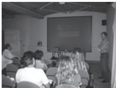
Imagen 12: Seminario de Investigación Inicial en Jódar (Jaén).

Su principal objetivo fue el de establecer una definición común del concepto de Patrimonio Oleícola y establecer los principales elementos inventariables en cada comarca para su posterior aplicación en el Catálogo del Patrimonio Oleícola.