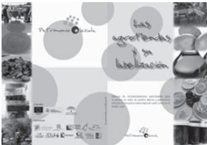
Imagen 11: Portada del Manual de recomendaciones.

responda a unos establecimientos caracterizados por unos criterios de calidad y de diferenciación con respecto a la venta de aceites típicos, así como de productos artesanales y culturales vinculados al olivar y al aceite de oliva.