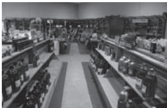
Imagen 5: Agrotienda situada en la comarca de Guadajoz y Campiña Este de Córdoba.

La Acción Conjunta de Cooperación coordinada por el Grupo de Desarrollo Rural de Sierra Mágina, ha reflexionado sobre estos temas y sobre la posibilidad de creación de una nueva vía de comercialización del aceite de oliva y productos derivados, más cercana al comprador o compradora, en circuitos comerciales de radio corto: agrotienda.