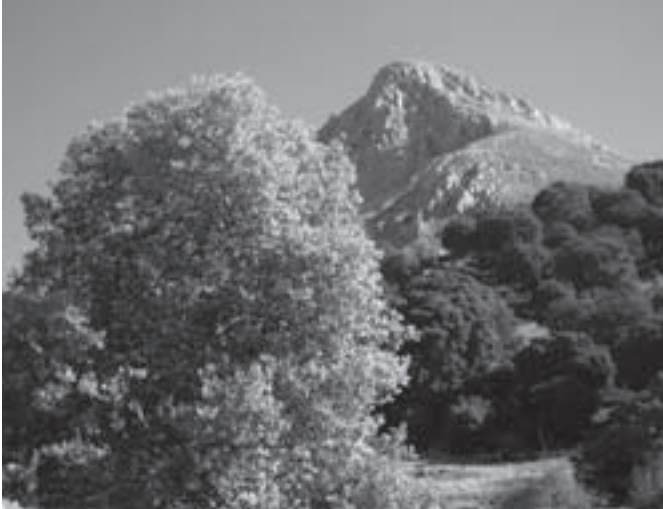
12.- La Peña de Jaén desde Los Prados

Seguimos caminando y justo antes de llegar a las ruinas del Cortijo de los Prados nace un