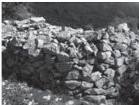
9A.- Caracol junto a la fuente del Espino

Seguimos caminando hacia el puerto y la vegetación que vemos ya es de alta montaña. Predominan los espinos, sabinas rastreras, enebros, piornos y aparecen algunos ejemplares de arenaria. Se trata de un lugar abierto con grandes pastizales. Un buen sitio para observar rapaces sobrevolando las cumbres de Mágina.