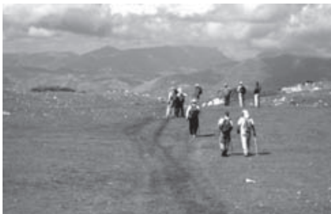
11.- El puerto de la Fuente Fría

Esta finca que ahora es de dominio público perteneció, por