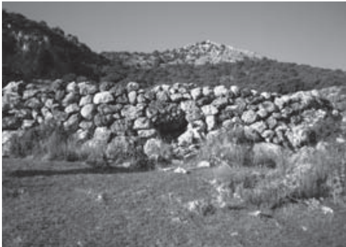
6.- Hormas de piedra seca (paratas)

los picos: Buitre, Chantre y la Peña del Cambrón, con la Sierra de Cazorla como fondo. Nos desviamos un poco a la derecha para observar la Fuente del Sapo entre juncos.