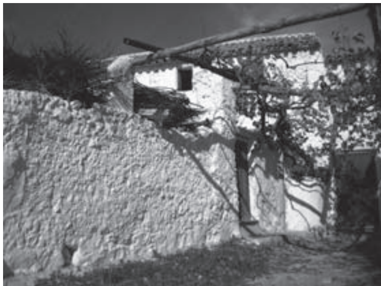
4.- Una casa en la aldea de Belmez

Estamos en el lugar de partida de la ruta a pie, pero antes pasearemos por este lugar mágico y contemplaremos sus cortijos blanqueados con las parras en sus fachadas y sus huertas regadas con abundante agua. Pero sin lugar a dudas lo más espectacular es su castillo, una estratégica fortaleza que desempeñó un importante papel durante tres siglos (XIII-XV) entre el Reino de Castilla y el Nazarita de Granada. Este castillo es