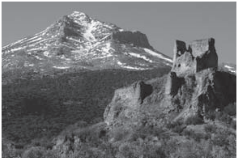
3.- El castillo de Belmez con la Peña Grajera o "Morra de Mágina" en segundo término

Cuevas de Baltibañas. Recomendable es asistir en el mes de agosto, sobre la tercera semana, a la representación de Moros y Cristianos, una continuación de la celebrada en la aldea de Belmez el primer domingo de mayo. Las dos se complementan y dan forma a una gran pieza dramática de gran valor cultural e histórico.