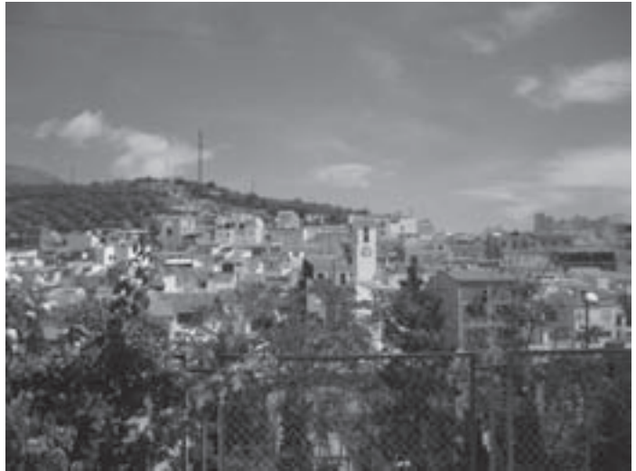
1.- Panorámica de Bélmez de la Moraleda

En esta ocasión he querido presentar una ruta con grandes matices históricos, ya que tiene como partida uno de los castillos más importantes de la frontera castellano-nazarí: el Castillo de Belmez. Una fortaleza de origen musulmán que domina el Valle del Jandulilla. Nuestra ruta terminará en el Castillo de Mata-Bejid, en pleno Parque Natural de Sierra Mágina, dando vistas al Valle del Guadalbullón. Habremos recorrido la cara norte de Mágina de este a oeste, caminando por algunas de las vías pecuarias que atraviesan el Parque Natural.