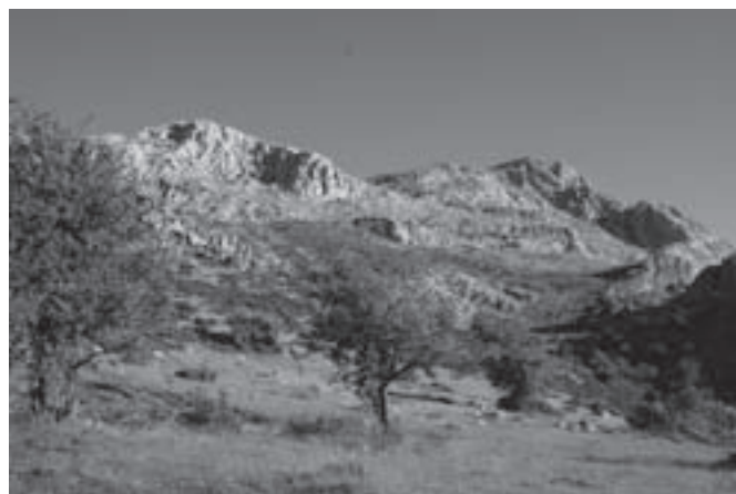
10.- Pastizales en la cara norte

Empieza nuestro camino a descender y pasamos, dejándolo a la izquierda, por el Cortijillo de los Cazadores y del abrevadero de Fuente Fría.