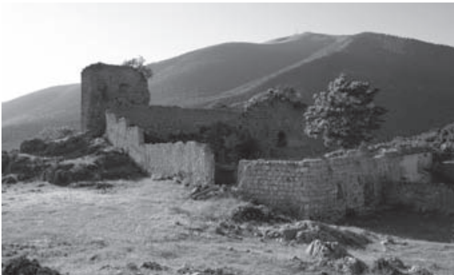
13.- El castillo de Mata Begid es el final de nuestra ruta

camino a la izquierda. Por este se va al Llano de los Vaqueros, lugar donde se encuentra uno de los ejemplares de encina de mayor porte del Parque Natural. Detrás del Cortijo de los Prados está la Fuente de los Prados. A la derecha, según seguimos el camino, se quedan las ruinas de este cortijo, donde encontraremos unos espinos en los que crece el muérdago y abajo, el barranco del Río Oviedo. Observamos prados y terrazas roturados en su tiempo para la siembra de cereales y legumbres.