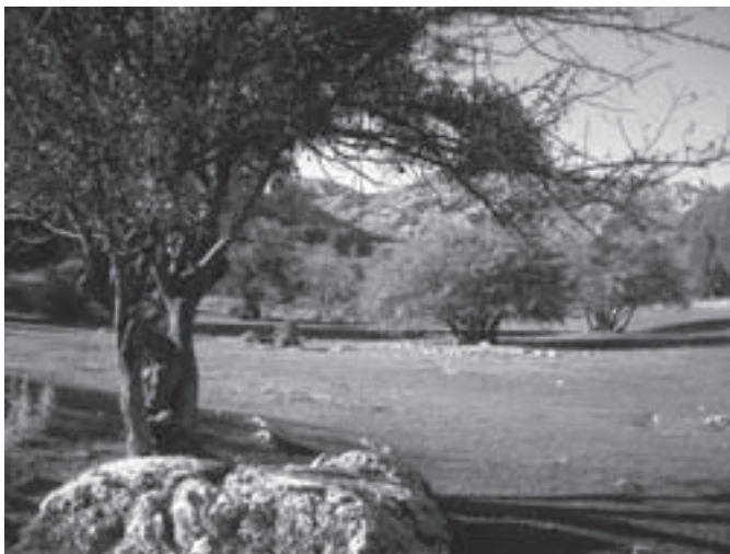
7.- El Hoyo de la Laguna

Justo bajo el Cerrillo de la Mina nos encontramos con los restos de un caracol de piedra seca, refugio de pastores. Detrás de este cerrillo hay un mirador espectacular que se abre hacia