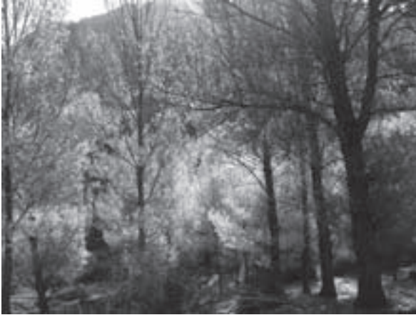
8.- Chopera del caño del Aguadero

Ahora nos encontramos con una espesa chopera de alta montaña, todo un espectáculo si tenemos en cuenta que andamos superando los 1600 mts de altitud. Llegamos al Abrevadero del Caño del Aguadero, un lugar para el descanso del ganado. Actualmente el pastoreo ha descendido mucho, pero podemos imaginarnos aquellos rebaños de miles de cabezas que antaño atravesaban la sierra en los cambios de estación, guiados por el rabadán y los pastores. Eran tiempos de la trashumancia.