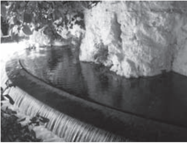
2.- Nacimiento de La Moraleda

Entramos en la población por el Paseo del Prado y justo a la derecha coincidimos con la Fuente de la Solana, un lugar magnífico para empezar a tomar fotografías, ya que nos ofrece una bonita panorámica del pueblo. Continuaremos por la Avenida de Andalucía y giraremos a la izquierda por la calle Alonso Vega hasta llegar al Parque del Nacimiento de la Moraleda. Aquí llenaremos nuestras cantimploras de agua fresca y cristalina y nos detendremos un momento para observar este manantial.