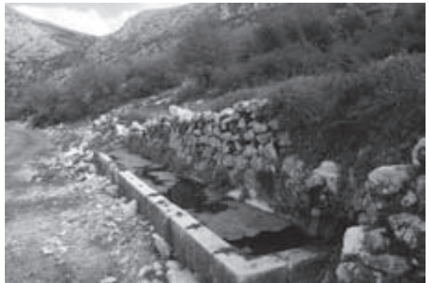
9.- Abrevadero del Espino

Transcurridos unos dos kilómetros, llegamos a otro abrevadero "El Espino" a 1750 mts de altitud. Con un pilón de piedra de gran valor. Justo sobre éste encontramos las ruinas de dos caracoles o chozos, utilizados durante muchos años por pastores y neveros. De forma redonda tiene dos habitáculos, uno era utilizado para dormir y el otro para cocinar. Muy cerca de allí y sobre una cornisa está la Sima de Mágina y los grandes neveros utilizados para la conservación de la nieve. A la