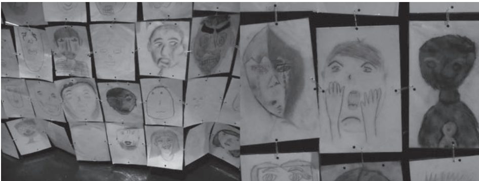
Figura 9. Podemos apreciar la variedad en los resultados finales de las pequeñas obras de arte.