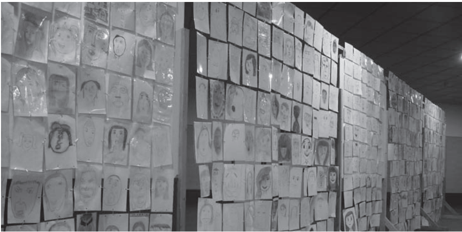
Figura 8. Los dibujos unidos por clips forman la cortina de expresiones.