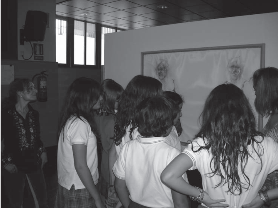
Figura 5: Los alumnos hacen preguntas frente a los cuadros.