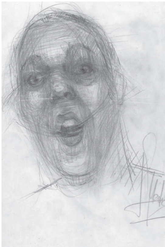
Figura 4: Obra acabada cuyo proceso de realización se mostró a los alumnos.

Una vez acabada esta presentación, Laura acompañó a los alumnos a ver las imágenes y delante de la obra continuaron surgiendo preguntas. El contacto con la artista se prolongó más allá del encuentro físico puesto que algunos alumnos le escribieron correos electrónicos para preguntarle lo que había quedado pendiente y para agradecerle su estancia en el colegio y felicitarle por su obra.