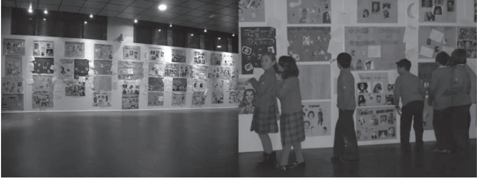
Figura 6. Los alumnos visitan sus trabajos «Catálogo de expresiones» y «Cambiamos la realidad»