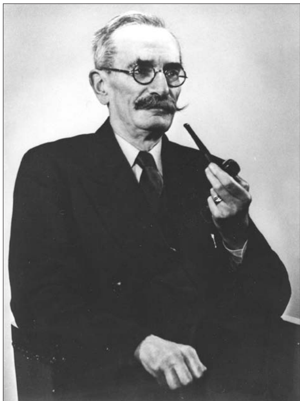
FIG. 1. Raoul Blanchard

de artículos aparecidos principalmente en Annales de Géographie . Aunque los artículos que se refieren a las ciudades bajo un aspecto particular, en concreto el económico, aparecen tempranamente, otros tratarán de ofrecer una visión más global, con base monográfica 22 . Pero lo que va a causar impacto es la aparición de dos obras de geografía urbana, que serán abundantemente citadas por sus contemporáneos: Grenoble, étude de géographie urbaine , de Raoul Blanchard, en 1912, y Rouen. Étude d'une agglomération , de Jacques Levainville, en 1913. Seguirán otros estudios, sobre todo en los trabajos del Instituto de Geografía Alpina (que dirigía Blanchard), representativos de esa «enérgica escuela de Grenoble» 23 , como fue calificada. A partir de entonces, la ciudad deja de ser un pretexto para comprender mejor algún proceso sociológico, y se convierte por sí misma en el tema de