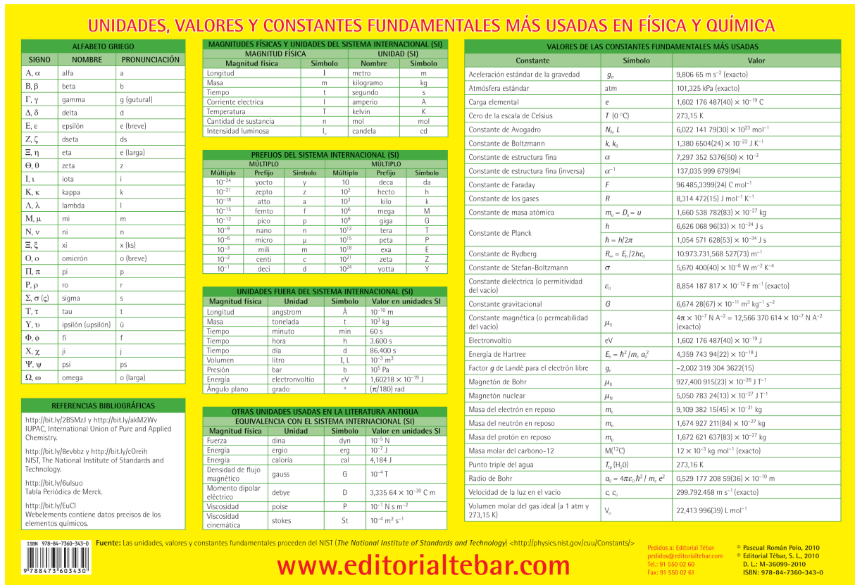
Figura 2. Unidades, valores y constantes fundamentales más usadas en Física y Química (Cortesía de Editorial Tébar).