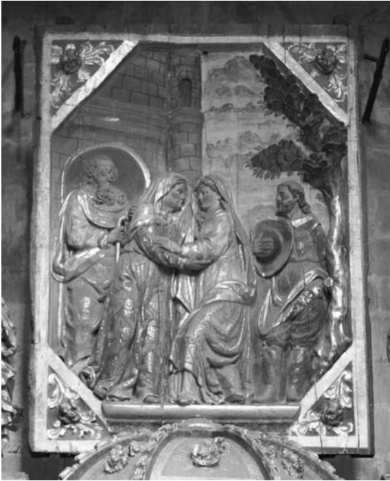
Figura 3. Visitació de la Mare de Déu a Santa Isabel. Relleu superior del retaule, amb el qual es pretenia recordar la dedicació original de la capella on anava situat el re-taule.