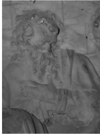
Figura 6. Apòstol. Detall d'un relleu procedent d'Escaladei