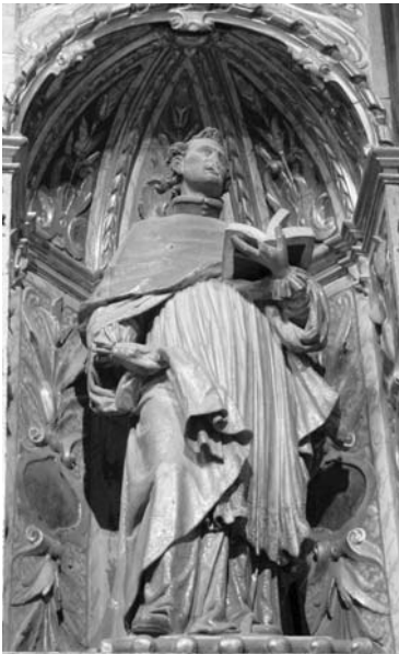
Figura 11. Sant Pere d'Arbués. Situada al cos lateral esquerre del retaule