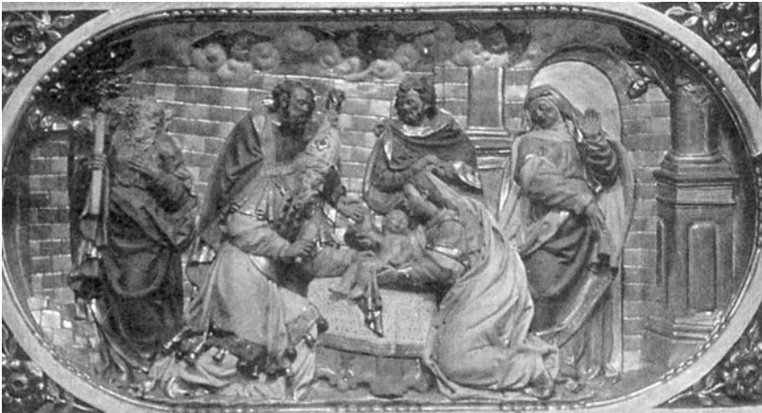
Figura 4. Presentació al temple. Detall de l'antic retaule del Nom de Jesús. Església de Maspujols.