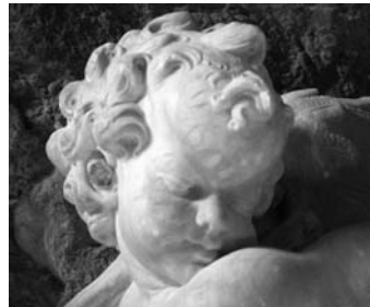
Figura 13. Querubí. Procedent de les obres que Espinalt féu el 1693 per a la capella de la Mare de Déu de la Cinta