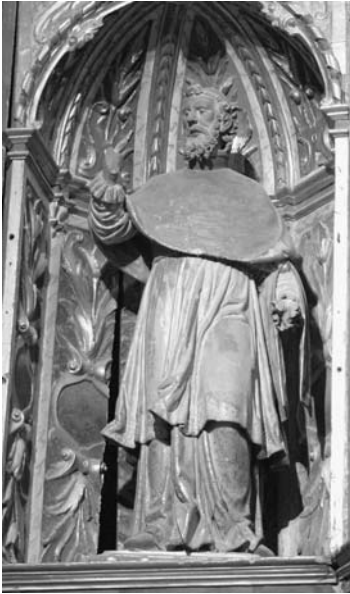
Figura 9. Sant Joan Nepomucè. Situat al cos lateral dret del retaule