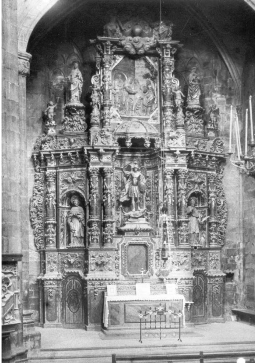
Figura 1. Retaule abans de 1936, que estava dedicat a sant Miquel Arcàngel