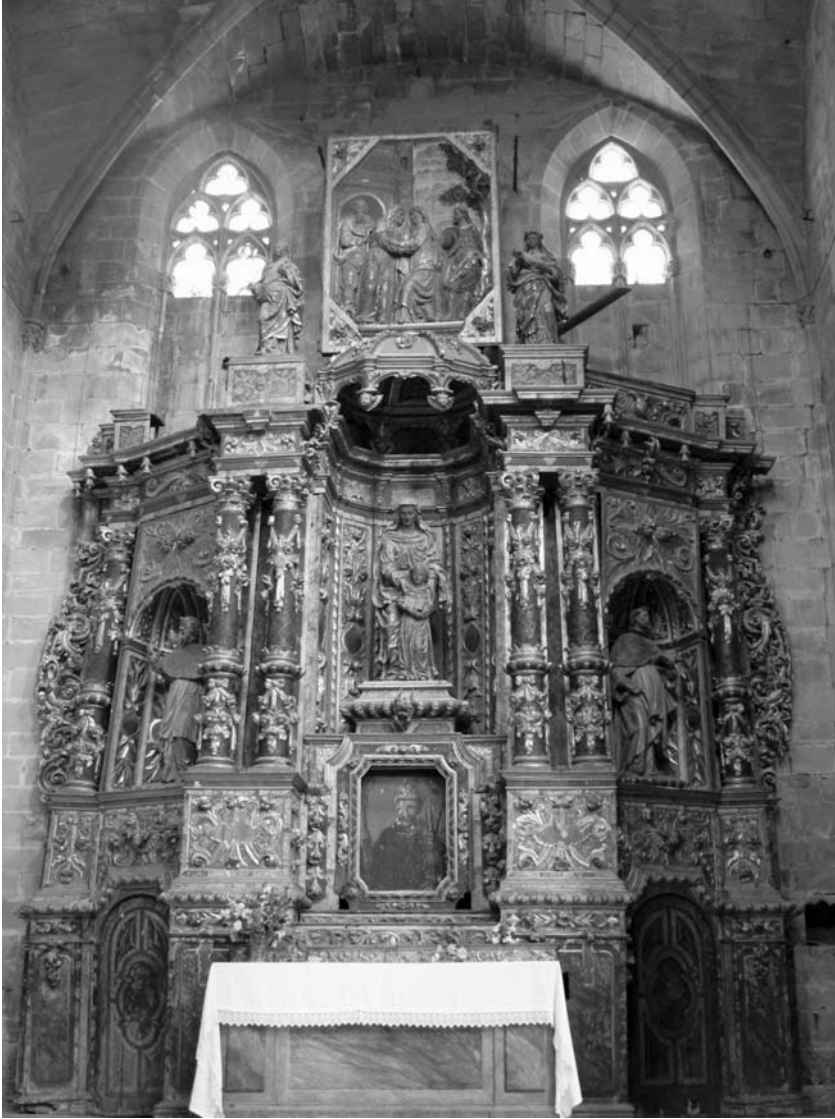
Figura 2. Retaule actual, dedicat a santa Anna

La relació d'Espinaltamb la ciutat de Tortosa s'inicia el 1693, quan contractà amb els canonges de la catedral la talla d'unes escultures d'alabastre destinades a la capella de la Mare de Déu de la Cinta, llavors en construcció. Del resultat d'aquest encàrrec es conserven les figures fragmentàries de quatre angelets