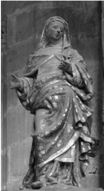
Figura 7. Santa Caterina de Siena, situada al costat dret del relleu de la Visitació