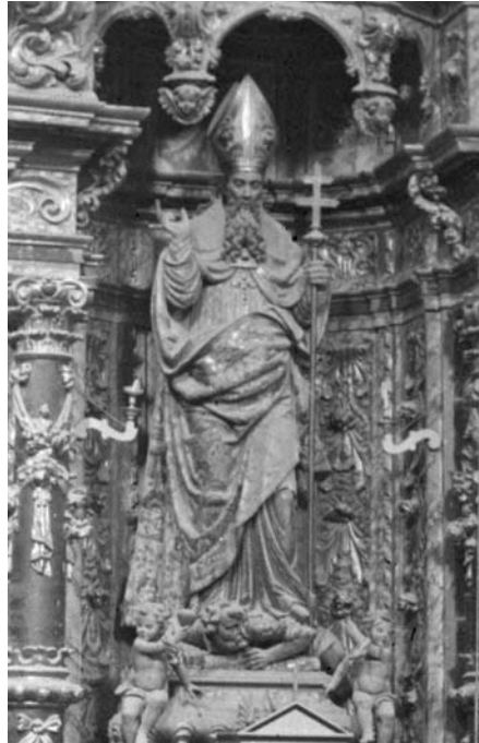
Figura 17. Sant Agustí. Detall del titular del retaule de Sant Agustí

del fill. També al fill s'ha d'adjudicar la figura de sant Pere d'Arbués; en canvi, la imatge de sant Joan Nepomucè seria del pare.