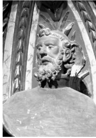
Figura 10. Rostre de Sant Joan Nepomucè.