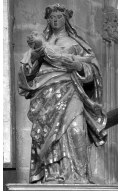
Figura 8. Santa Rosa de Lima. situada al costat esquerre del relleu de la Visitació