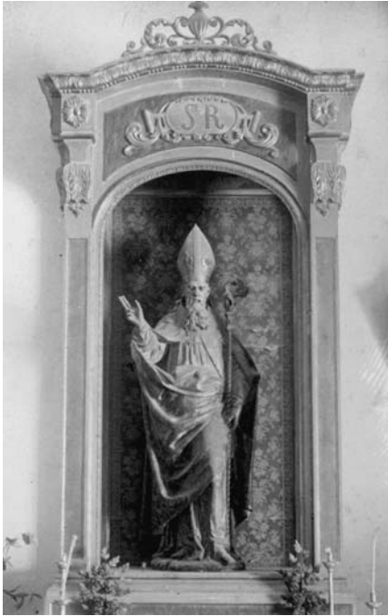
Figura 16. Possible imatge central del retaule de sant Ruf, traslladada a la parròquia de Roquetes l'any 1833 i cremada el juliol de 1936.