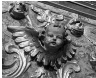
Figura 12. Querubí. Detall del retaule de sant Ruf.