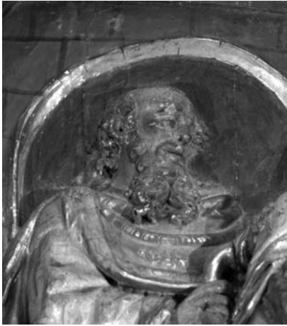
Figura 5. Sant Zacaries. Detall de la Visitació