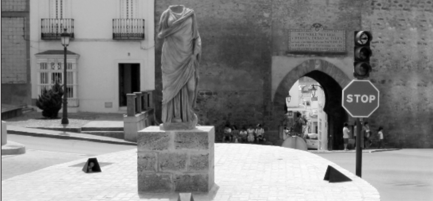
Imagen 1.-Reproducción de la escultura original, frente a la Puerta de Jerez.