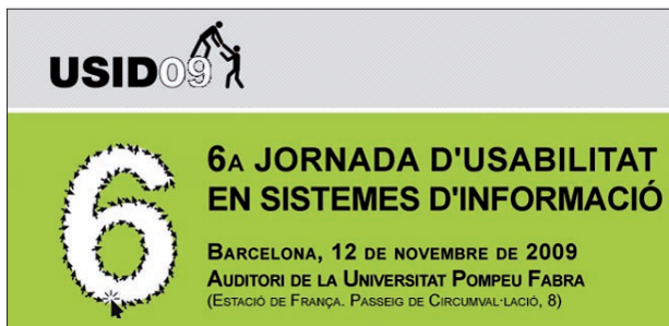
Figura 1. Jornadas Usid, http://www.usabilitat.org

Son tres eventos de larga tradición a los que merece la pena ir al menos a uno de ellos al año.