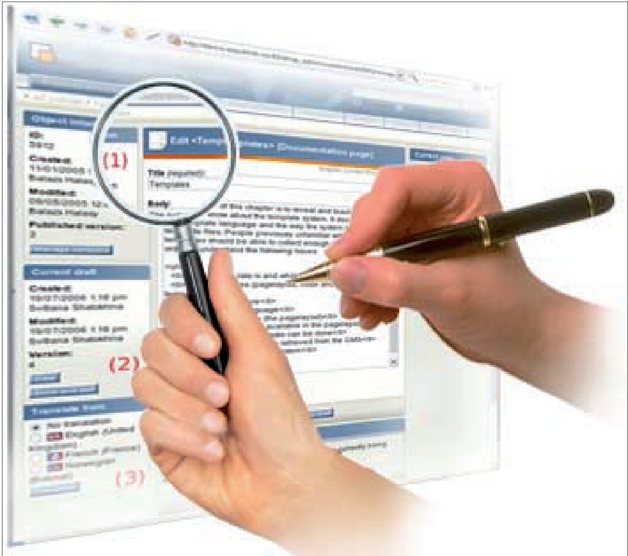
Figura 4. Usabilidad, http://www.jasoft.org

un teléfono móvil, los mandos de una consola, el cajero automático, el expendedor de billetes del metro, etc. Todos estos sistemas con los que interactuamos tienen aún mucho por mejorar para no caer en la complejidad.