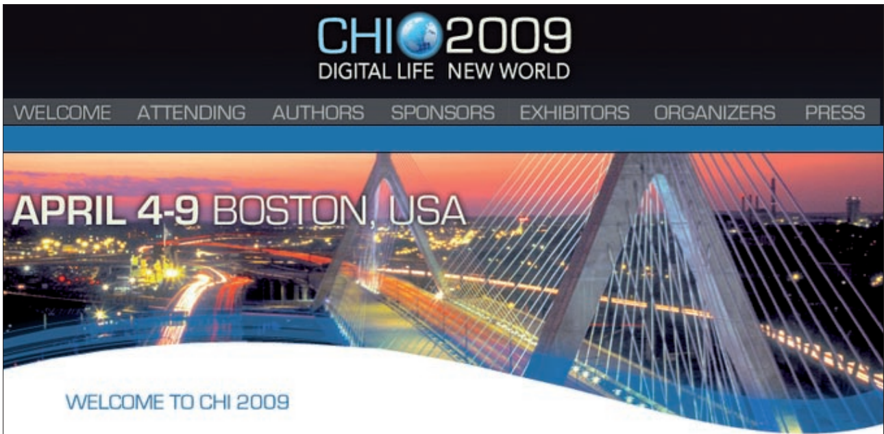
Figura 2. CHI 2009

las técnicas de persuasión acompañadas de una base de usabilidad para lograr obtener beneficios en el sitio web. Es un libro de lectura amena muy recomendable.