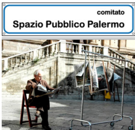
Fig.1 Reapropiación de Piazza Bellini, Palermo

A esta plaza, destino turístico obligado para cualquier visitante, se empezaron a trasladar todas aquellas funciones que tendría que haber en un espacio público: primero intentando quitar los coches (o haciéndolos “desaparecer” con manteles y usándolos como mesas para tapear) y luego creando espacios de estancia (juegos creativos que implicaban la presencia de otros ciudadanos). Casi una vez al mes se empezó y se sigue organizando algo en este espacio y con ello se le ha devuelto el papel público a un espacio olvidado por la administración, que además lo usa para aparcar sus coches.