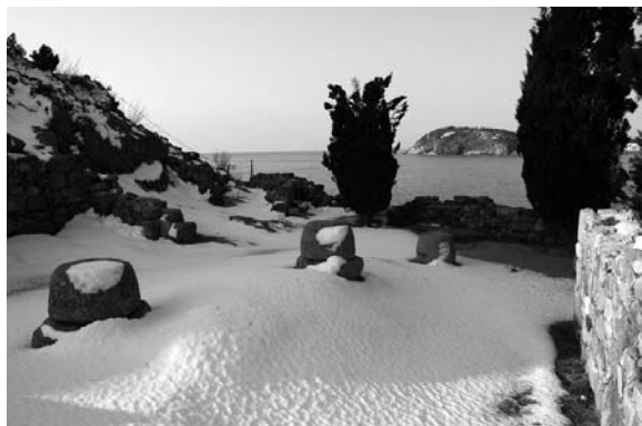
Runes del poblat ibèric de Castell

El temps semblà alentir-se sota la neu. Tot s'immobilitzava i emmudia sota el suau espectacle d'aquell dilluns de març. Els afortunats que podien gaudir de la contemplació de l'escena a