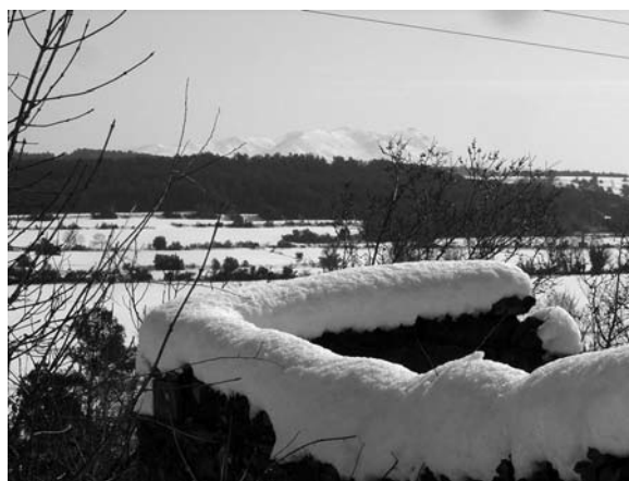
El Montgrí nevat

recer d'una bona finestra no podien evitar sentir una pau tímida, clara, neta.