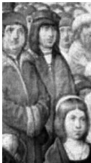
Detalle: Juan de Albret (izquierda) y los Reyes Católicos.

Este segundo acuerdo significó la ruptura de los reyes de Navarra con las cláusulas políticas acordadas poco tiempo antes con Juan de Foix y su hijo Gastón, al renunciar al cumplimiento del tratado de Tarbes (abril de 1499), por el cual el soberano de Francia se había garantizado que los príncipes navarros casarían con nobles franceses.