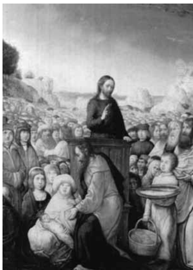
Multiplicación de los panes y los peces. Juan de Flandes (Palacio Real de Madrid).

También se estipuló que si se daba el caso de que los Reyes Católicos desestimaran la realización de estos enlaces matrimoniales, los monarcas navarros no casarían a sus herederos sin previo consentimiento de aquellos 30 .