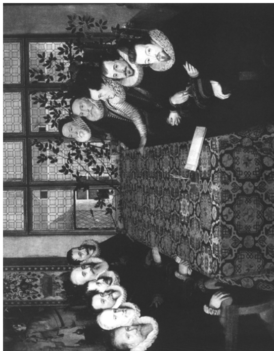
Fig 5. Conferencia de Somerset House. Juan Pantoja de la Cruz. The National Portrait Gallery. Londres