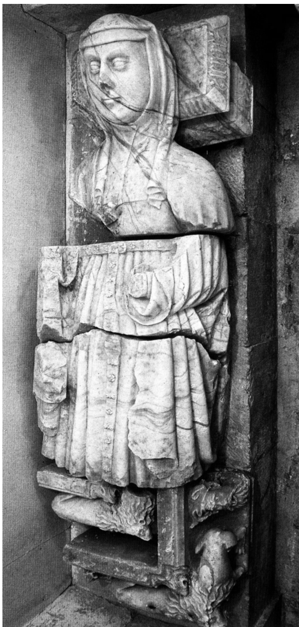
Fig. 3. Figura sepulcral de Maria Solier . Monasterio de Santa Clara. Medina de Pomar (Burgos).