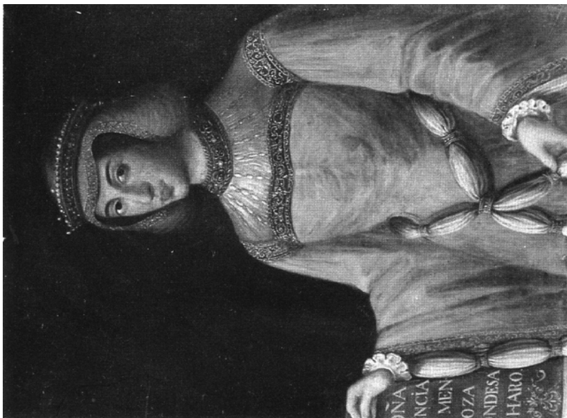
Fig. 2. Retrato de Mencía de Mendoza . Capilla del Condestable. Catedral de Burgos.