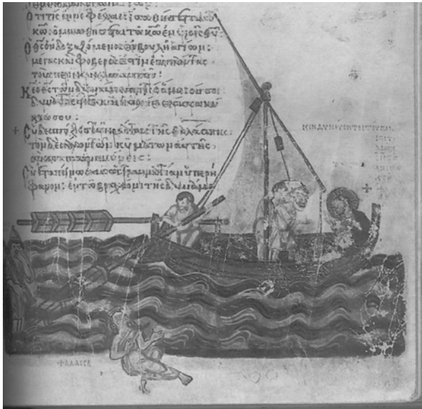
Fig. 1. Cristo calma las aguas . Segundo tercio del siglo IX. F. 88 r. Ms. Gr. 129. Salterio JIúdov . Museo Histórico del Estado. Moscú.

de las ideas políticas. Su influencia sería duradera 42 . En última instancia, no está de más recordar que Moisés y Elías se reunirían en la escena de la Transfiguración , la escena que decora el ábside principal del katholikon del monasterio de Santa Catalina del Monte Sinaí; una obra notable por el rigor del dibujo y la delicadeza de los colores, en un estilo que remite a Constantinopla 43 .