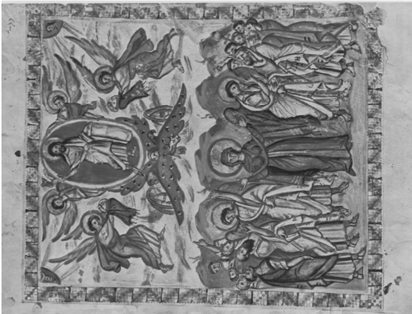
Fig. 3. Ascensión. 586. F. 13 v. Biblioteca Medicea Laurenziana. Florencia.