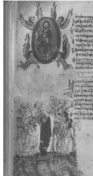
Fig. 2. Ascensión . F 46 v. Salterio JIúdov .