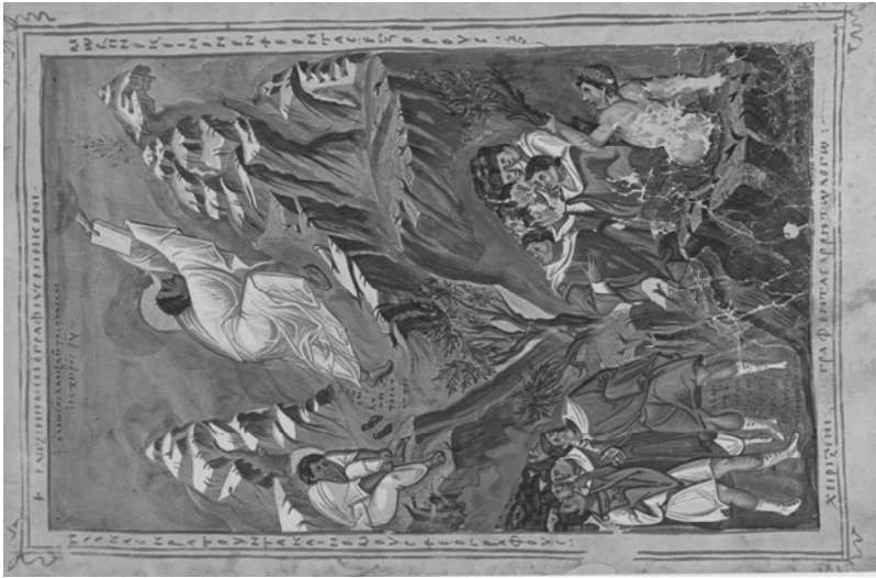
Fig. 6. Moisés recibe las Tablas de la Ley . Hacia 940. Ms. Vat. Reg. Gr. I, f. 135v. Biblioteca Apostólica Vaticana. Ciudad del Vaticano. Vaticano