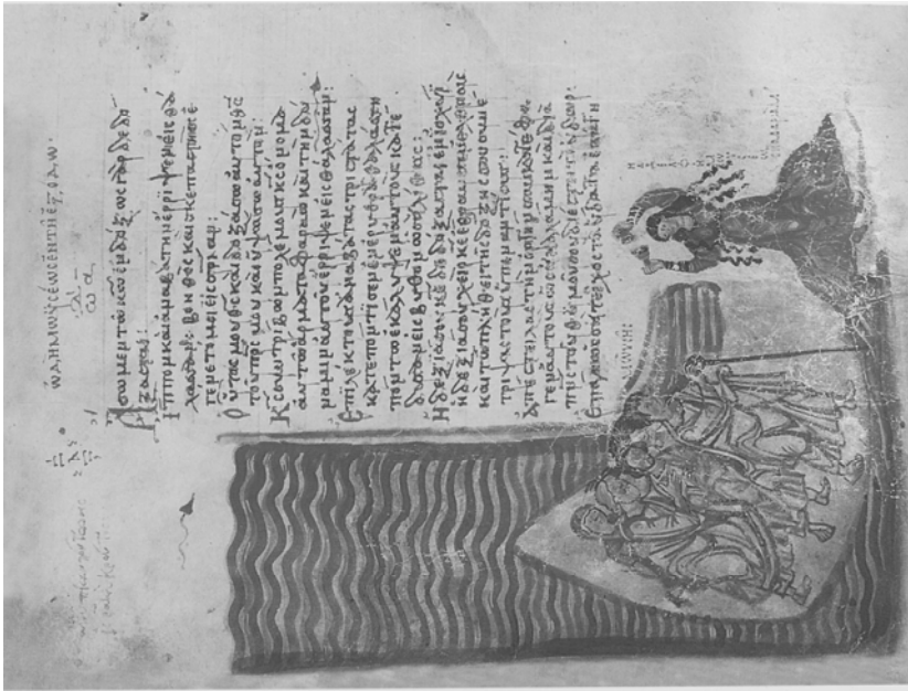
Fig. 4. El paso del mar rojo. La danza de María. F. 148 v. Salterio Jldov.