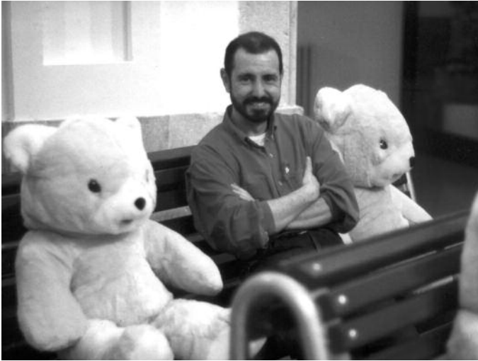
Casal Pere Quart de Sabadell (inícis dels anys 90)

S'haurien d'haver quedat sempre a casa i no molestar la bona gent ni formar aquests carnivals que van malmetre la imatge idíl·lica de les Rambles de sempre amb les seves manifestacions.