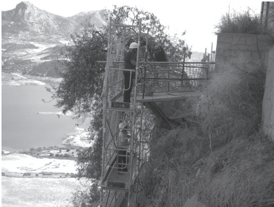
Lámina 5. Trabajos en el Sector Hotel.

Como hemos mencionado, este camino comunica con un segundo puente que desemboca en una torre de andamios por la que accede el personal y el material al tajo en cuestión, en cuyo frente también se han colocado medios de protección colectivos. En la consolidación de esta zona de la cerca de la Villa Medieval se están empleando tanto trabajos verticales como técnicas más convencionales desde el andamiaje.