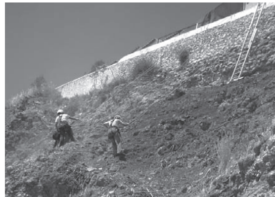
Lámina 4. Trabajos verticales en el Sector Cementerio.

Los problemas planteados en el Sector Cementerio se han solventado con el empleo de técnicas de alpinismo aplicadas a trabajos en altura, en un 70% de la superficie total de obra, y con la colocación de un primer cuerpo de andamios, en la zona más amplia de la salida de la población, y el montaje de un puente desde este cuerpo hacia el paño a restaurar, aparte de cortes intermitentes de la calle, imprescindibles para la limpieza y desescombro de las cimas de los muros y el desalojo de los escombros.