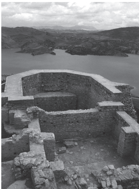
Lámina 6. Excavaciones en la iglesia de Santa María de la Mesa.

“Recuperación y Puesta en valor de Yacimientos Arqueológicos de la Sierra de Cádiz”, promovido por la Mancomunidad de Municipios y tomando ya la denominación de Ruta Arqueológica de los Pueblos Blancos. Siempre en una línea de potenciación de los recursos endógenos comarcales, en este caso patrimoniales y turísticos, con el fin de favorecer el crecimiento económico y el empleo (COBOS 1998).