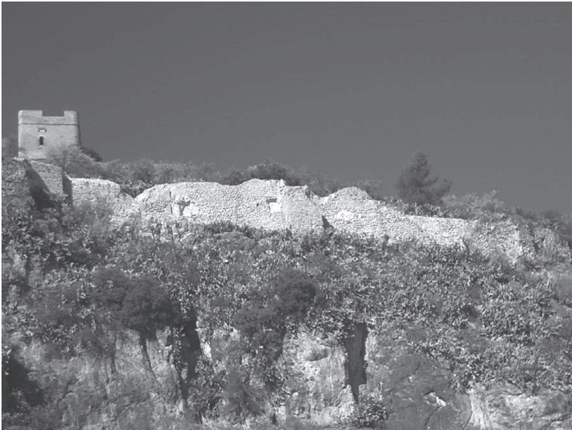
Lámina 9. Restauración de la cerca externa oriental. Taller de Empleo Sajrat'Abbad.

denominamos Recinto Intermedio, se ha definido de forma más completa la Alcazaba, se han localizado los restos de una canalización romana de opus signinum que debió tener una parte aérea sobre arcadas, hoy desgraciadamente perdidas, avanzamos una hipótesis sobre la colocación del Real y de las bombardas durante el primer asedio cristiano, etc. En fin, una avalancha de nueva documentación que estamos preparando para su futura publicación.