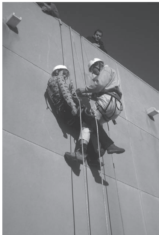
Lámina 2. Maniobra de rescate en el Curso de Trabajos Verticales.

La formación de los participantes en estos programas ha sido, por tanto, el objetivo primordial, así como su posterior inserción sociolaboral. Para ello siempre se ha intentado ofrecer una formación en la especialización hacia procedimientos y técnicas de trabajo novedosos y demandados en el mercado laboral; prueba de ello son los cursos de Técnicas de Alpinismo aplicadas a Trabajos de Restauración y Consolidación (Trabajos Verticales), cursos de Aplicación de Fitosanitarios, para el control de la proliferación de malas hierbas en yacimientos arqueológicos, o el Curso de Montaje de Andamios y Estructuras Metálicas impartido en el último Taller de Empleo. Además se han realizado programas de formación complementaria como Prevención de Riesgos Laborales, Dibujo Arqueológico o iniciación a la topografía. Todo ello, como hemos mencionado, dirigido a la mejora de la situación laboral de una gran parte de la población y, por otro lado, a la revalorización del espacio público Villa Medieval.