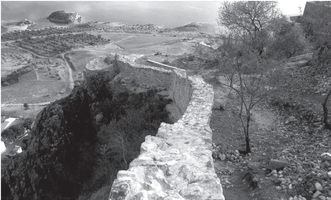
Lámina 8. Restauración de la cerca occidental. Taller de Empleo Nazari.

los lienzos occidentales de la cerca externa de la muralla. Durante el desarrollo de los trabajos de consolidación comenzamos a perfilar las fases constructivas del perímetro defensivo.