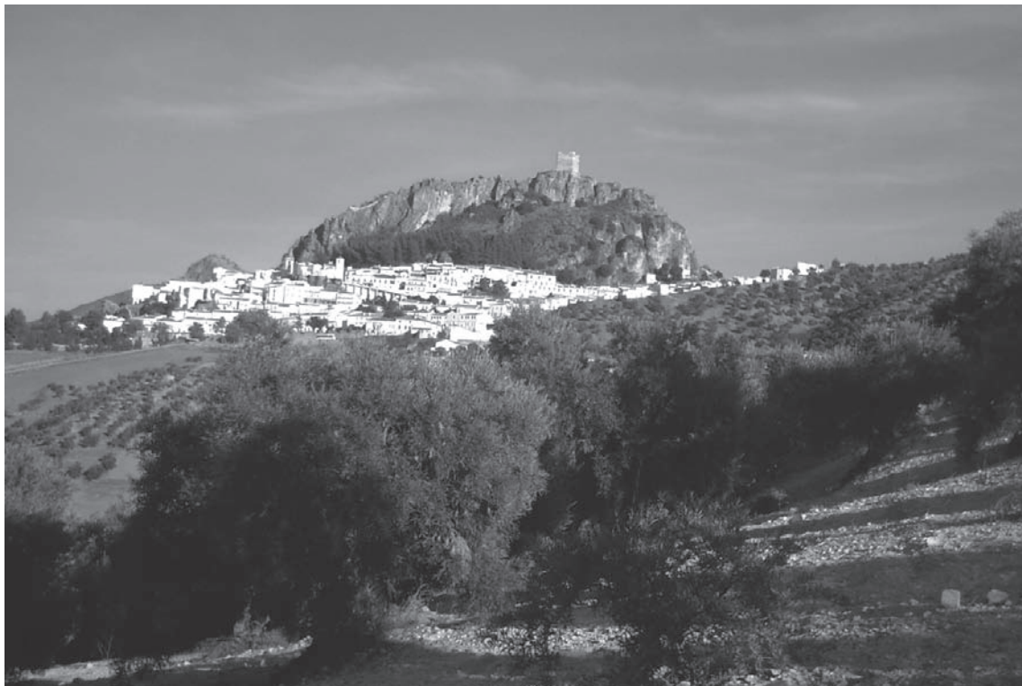
Lámina 1. Vista de Zahara desde el Oeste con el yacimiento al fondo.

En cuanto a los aspectos sociales y poblacionales, nos encontramos con una propiedad fundiaria muy pequeña, fragmentada y dispersa, predominando la pequeña y mediana propiedad frente a la gran propiedad concentrada