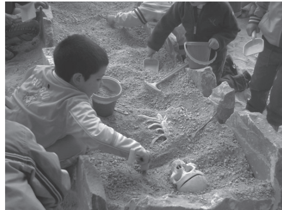
Lámina 3. Simulación de excavación arqueológica.

En el parterre de menor tamaño recreamos el mundo funerario, construyendo una cista de piedra caliza y depositando un esqueleto de plástico con su ajuar cerámico.