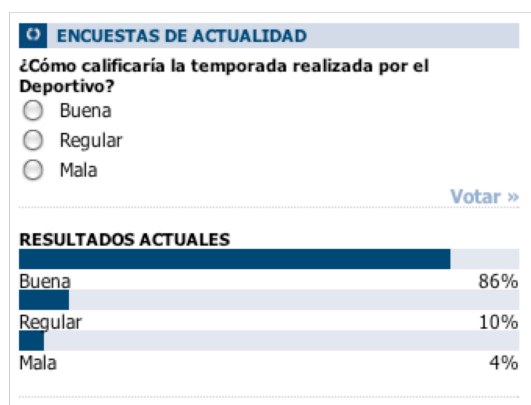
Figura 3. Sistema de votación de la Opinión de A Coruña

Aunque en un entorno completamente real los alumnos del grupo M deberían descubrir por su cuenta las URLs, CGIs y parámetros del sistema de votación, en este caso se proporcionará una interfaz para facilitar el trabajo y conseguir compatibilidad entre las prácticas. Así, será posible probar el funcionamiento de todos los B contra todos los M.