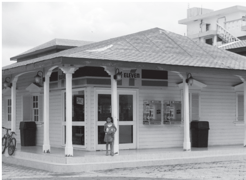
FIGURA 5. PROPIETARIA: MIRIAM NAMUR COLDWELL DIRECCIÓN: 5ª AVENIDA Y JUÁREZ. ADQUIRIDA EN 1950. ACTIVIDAD: MINISÚPER 7 ELEVEN.