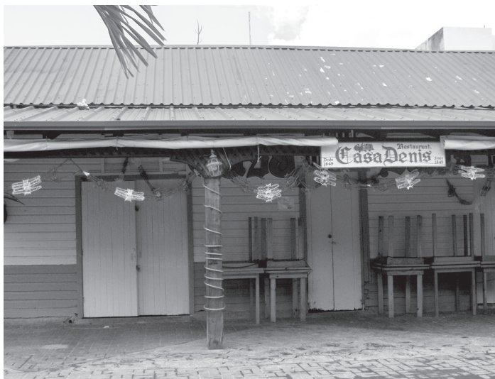
FIGURA 9. PROPIETARIO: ROMEO ÁNGULO MARRUFO DIRECCIÓN: 1ª SUR NÚM. 132. AÑO DE CONSTRUCCIÓN: 1912. ACTIVIDAD: RESTAURANTE.