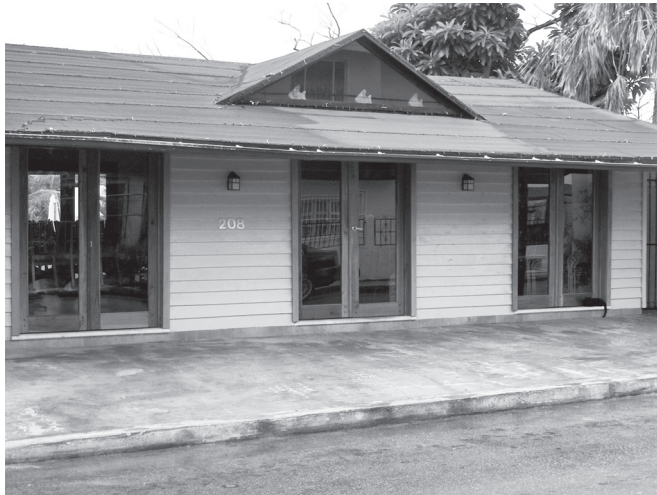
FIGURA 7. PROPIETARIA: KATHLEEN KLEIN DIRECCIÓN: CALLE 8 NÚM. 208 ENTRE 10. AÑO DE CONSTRUCCIÓN: 1984. ELABORADA POR CARPINTEROS LOCALES. ACTIVIDAD: RESTAURANTE.

El propietario de la construcción que se observa en la figura 6, Héctor Díaz Linares, menciona que aquella es de 1992, desde el principio fue diseñada para la actividad comercial restaurantera y fue edificada por carpinteros de la isla.