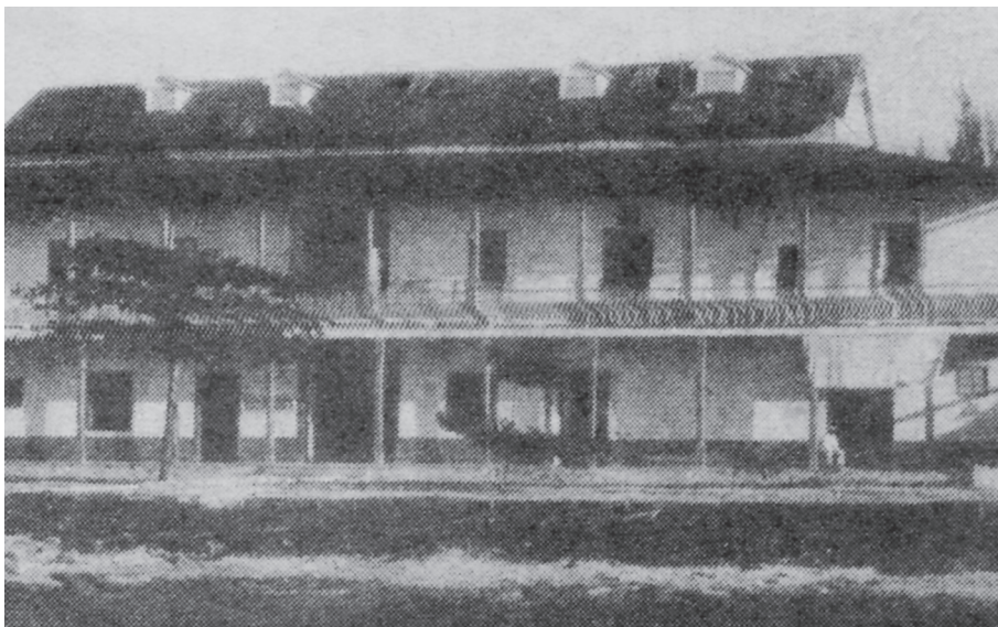
FIGURA 1. ADUANA MARÍTIMA 1919