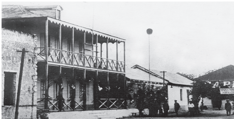
FIGURA 3. PALACIO MUNICIPAL 1929