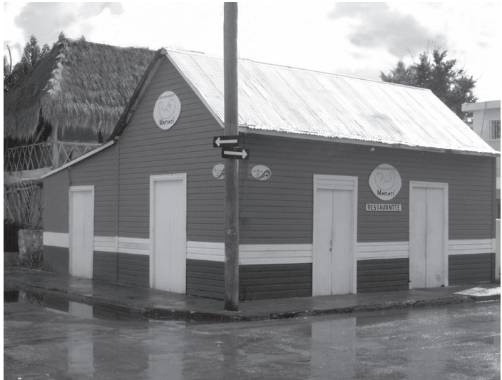
FIGURA. 8 PROPIETARIA: TOMASA MÉNDEZ. DIRECCIÓN: CALLE 8 NORTE Y 10ª AVENIDA. AÑO DE CONSTRUCCIÓN 1926. ACTIVIDAD: RESTAURANTE.