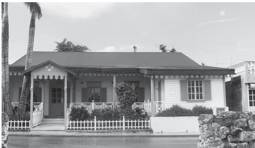
FIGURA 6. PROPIETARIO: HÉCTOR DÍAZ LINARES DIRECCIÓN: CALLE 4 NORTE NÚM. 140 ENTRE 5ª Y 10ª AVENIDA. ELABORADA POR CARPINTEROS LOCALES. ACTIVIDAD: RESTAURANTE.